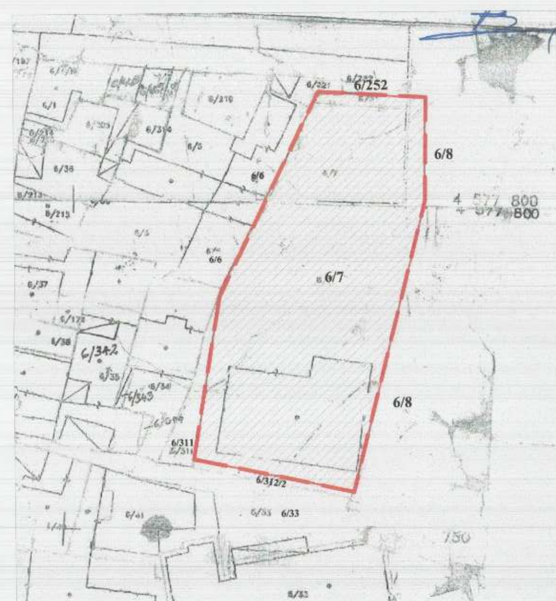
POZICIONI KADASTRAL SHK. 1:500