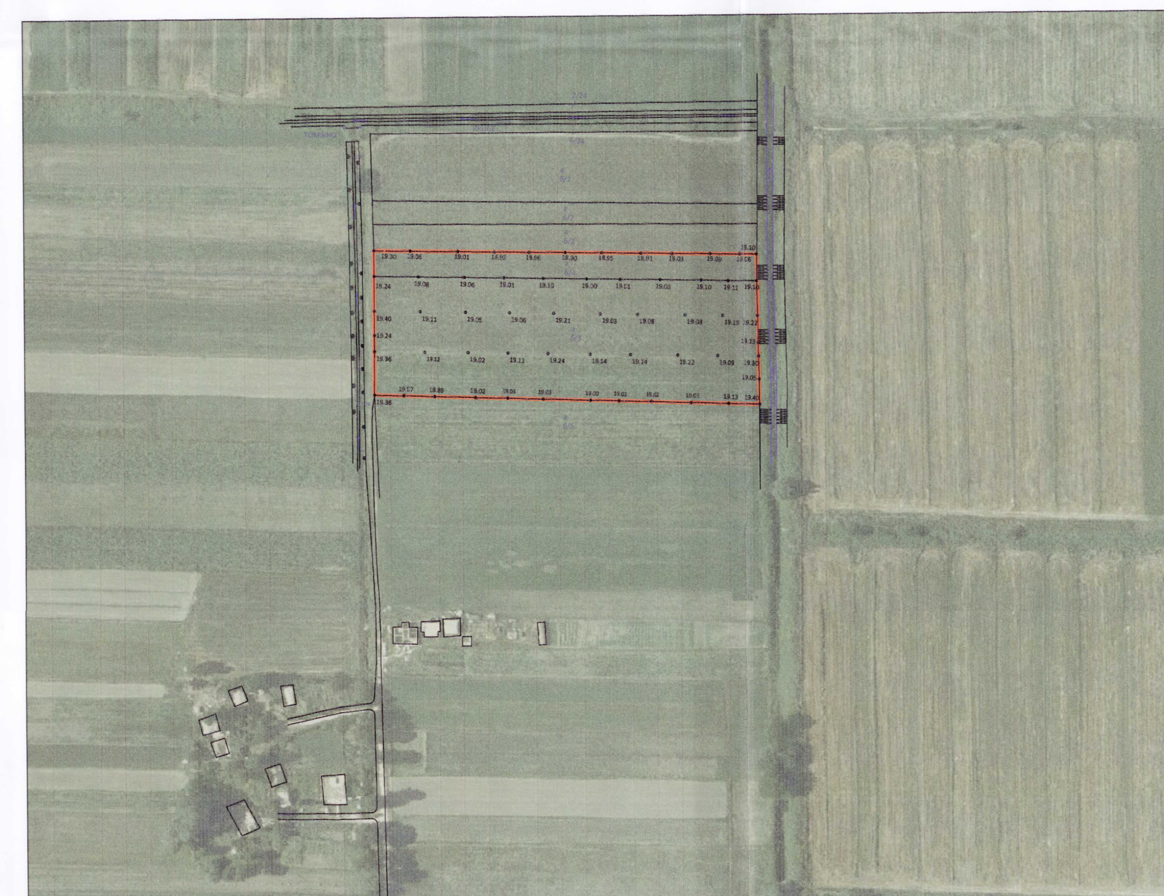
HARTA TOPOGRAFIKE, SHK. 1:2000