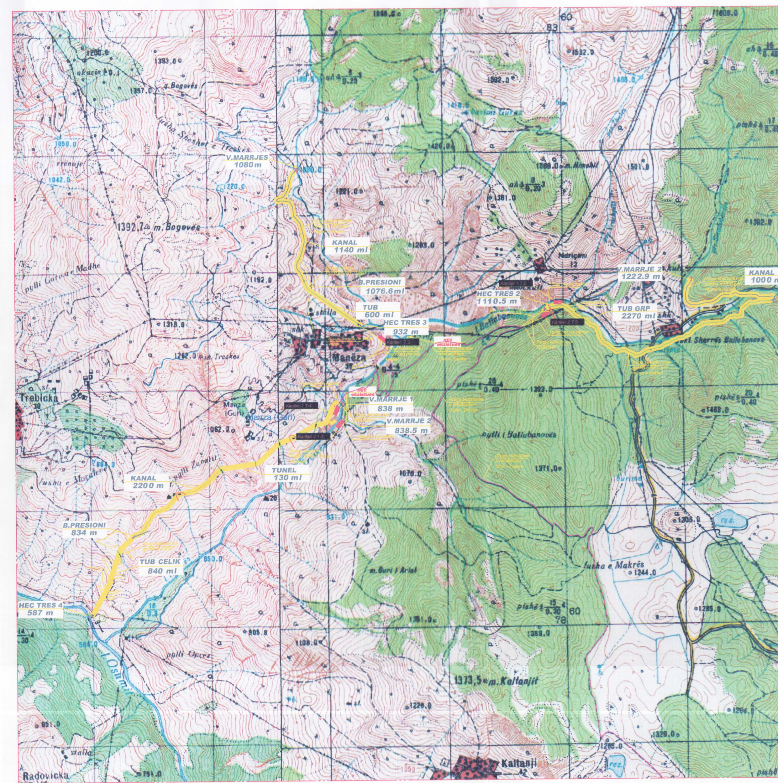
HARTA TOPOGRAFIKE SH. 1:20000

TREGUESIT E ZHVILLIMIT SIPERFAQE NDERTIMI 16 000 m 2 SHESH PER NGRITJE KANTIERI 1000 m 2 SHESH PER DEPOZIT. PERP. MAT. 1500 m 2 RRUGE PER NE HEC 17 500 (5kmX3.5m) m 2 LINJE ELEKTRIKE 35 kV, 18 km HEC TRESKA 4 V.M, DEKANTUES KUOTA 836 m KANALII DERIVACIONIT L=2200 ml TUNELI BXH(4X3.5m), L=300 ml BASENI I PRESIONIT KUOTA 834 m TUBACIONI I PRESIONIT D=1000 mm, L=840 ml NDERTESA E HEC KUOTA 587 m FUQIA E INSTALUAR N=3600kW HECTRESKA 3 V.M, DEKANTUES KUOTA 1080 m KANALI I DERIVACIONIT L= 1140 ml BASENI I PRESIONIT V=1076.6 m TUBACIONI I PRESIONIT L=600 ml NDERTESA E HEC KUOTA 932 m FUQIA E INSTALUAR N=400kW HECTRESKA 2 V.M1, KUOTA 1220 m V.M2, DEKANTUES+BASEN KUOTA 1222.9 m TUBACIONI I PRESIONIT (GRP) L=2270 ml NDERTESA E HEC KUOTA 1110.5 m FUQIA E INSTALUAR N=620kW