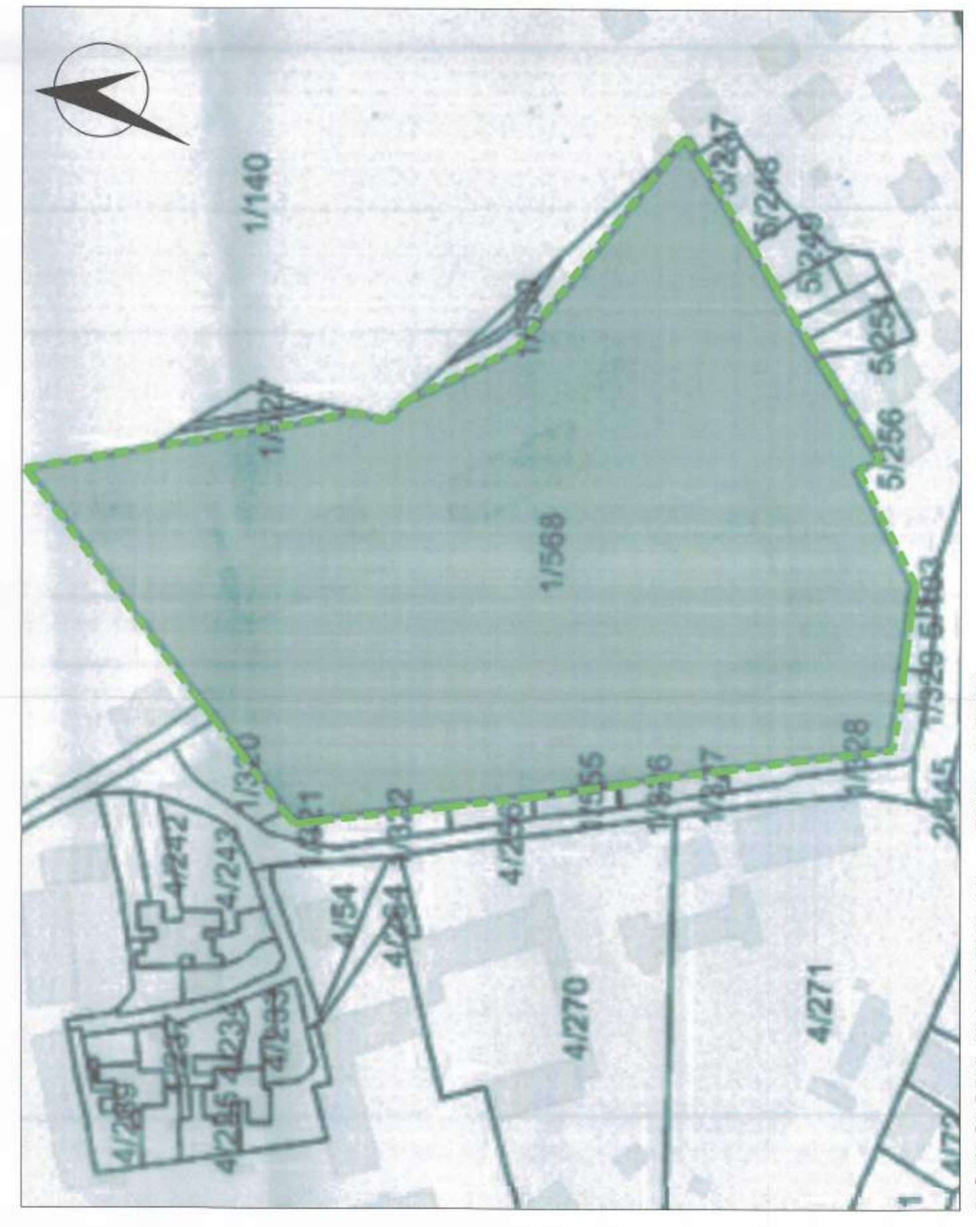
POZICIONI KADASTRAL SHK. 1:5000