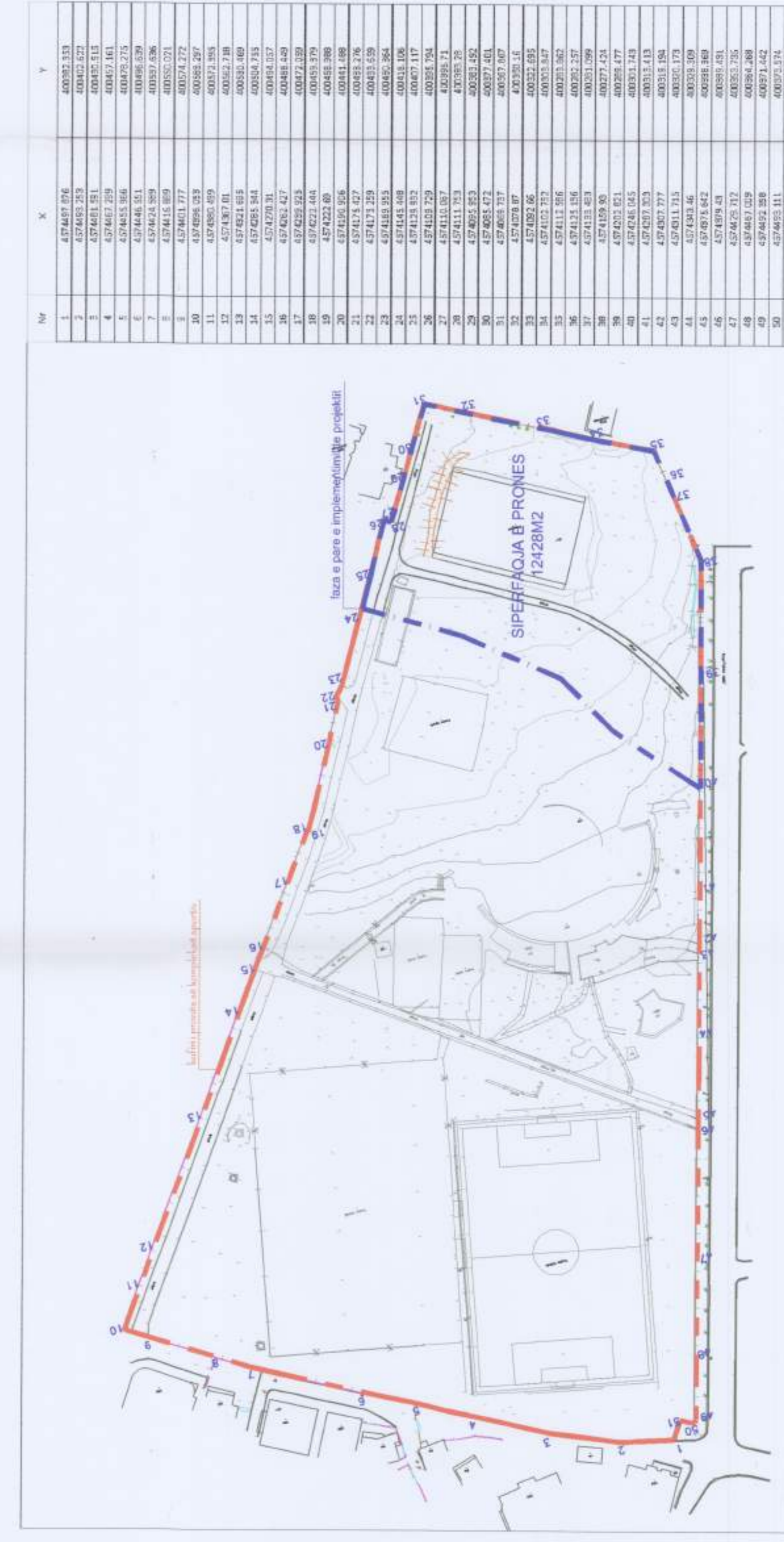
HARTA TOPOGRAFIKE SHK. 1:1500