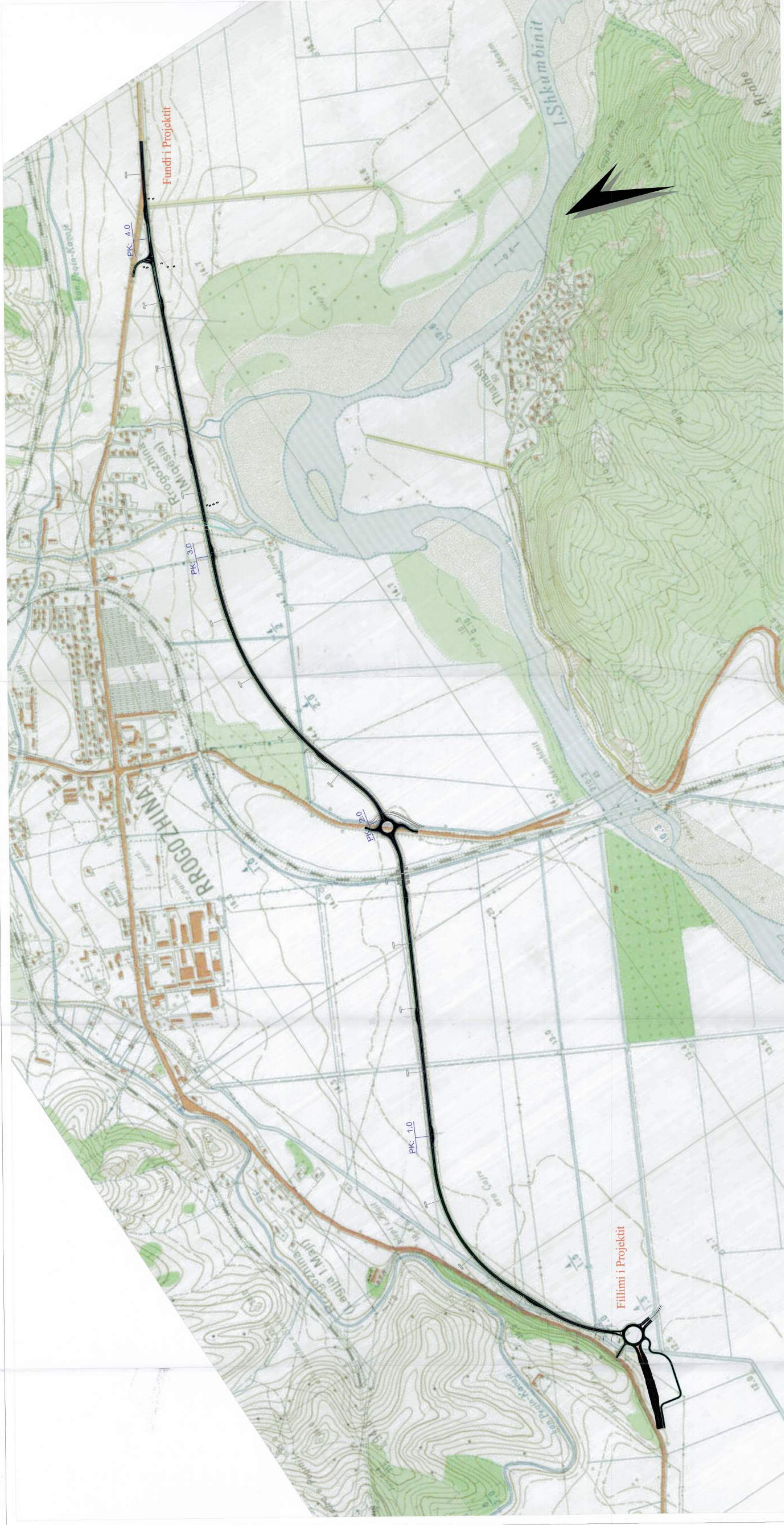
PLANI I VENDOSIES SË STRUKTURËS SHK. 1:5000