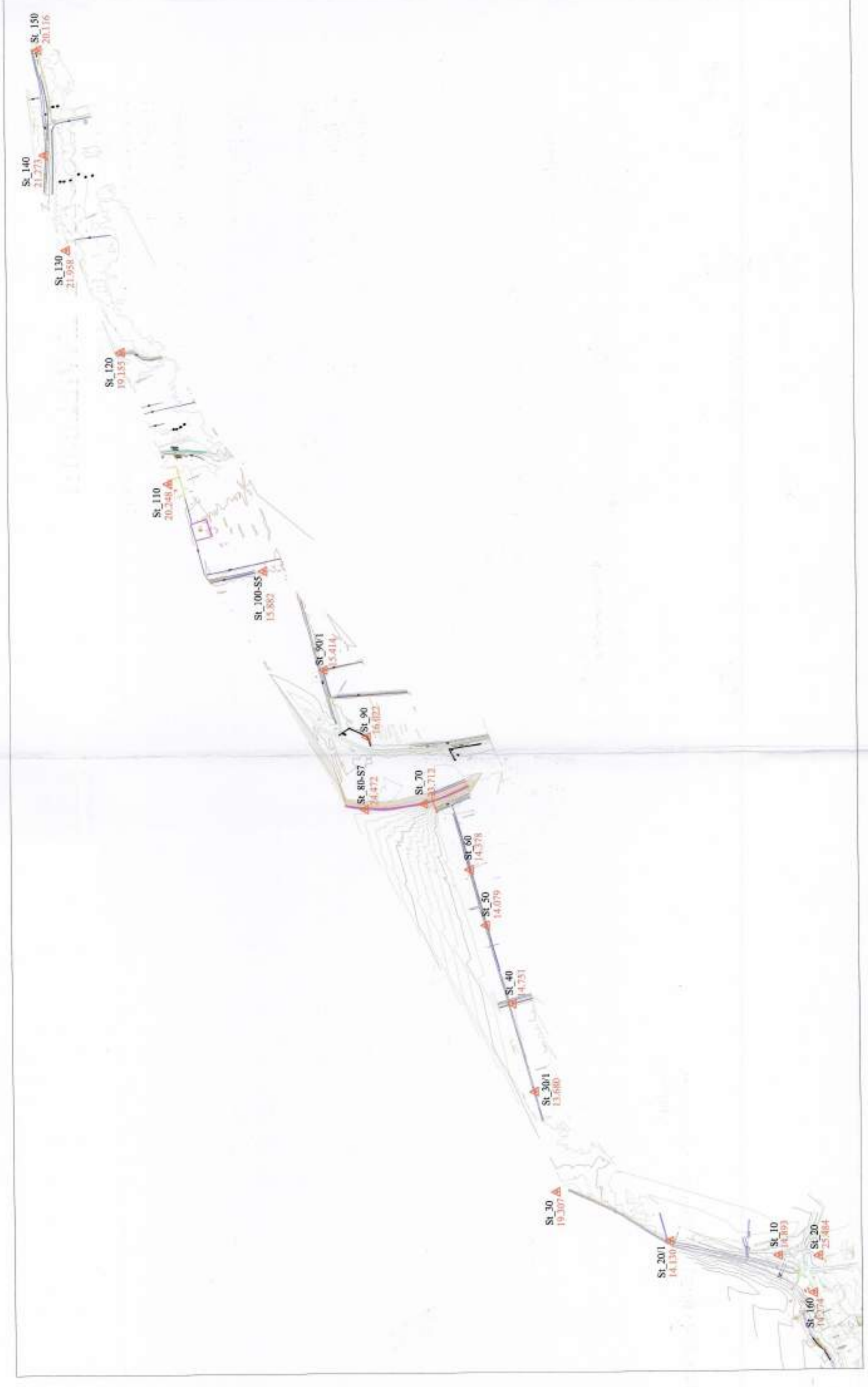
HARTA TOPOGRAFIKE SHK. 1:10 000

TREGUESIT E ZHVILLIMIT: Kategoria C - Rrugë Interurbane Dytësore 4.3 Km Gjerësia totale e Rrugës 12.0 m Gjerësia e plotë e kurorës së Rrugës 10.5 m Gjerësia e Rrugës së asfaltuar 10.5 m