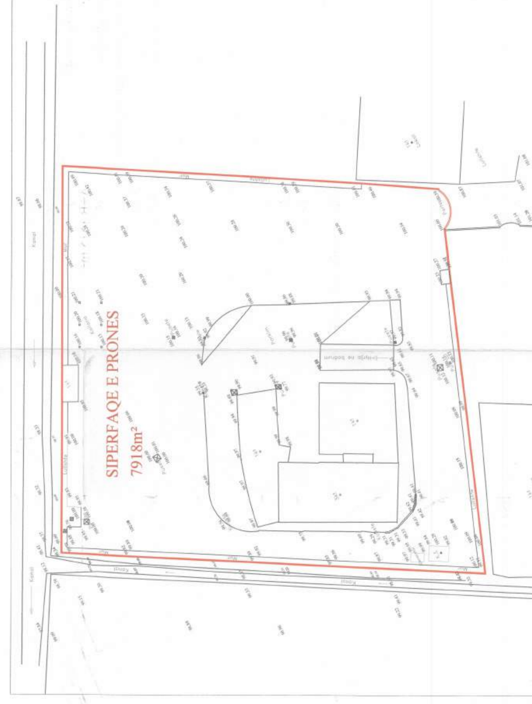
HARTA TOPOGRAFIKE SHK. 1:500

TREGUESIT E ZHVILLIMIT: Sipërfaqe e përgjithshme e truallit: 7918 m 2 Sipërfaqe e truallit që përdoret për zhvillim: 7118 m 2 Sipërfaqe e truallit të zënë nga struktura (gjurma): (A) 335M; (B) 340m 2 Sipërfaqe e përgjithshme e ndërtimit: A+B 1515 m 2 Koefficienti i shfrytëzimit të truallit për ndërtim: 8.5% Koefficienti i shfrytëzimit të truallit për rrugë dhe hapësira publike: 0.19 Inteniteti i ndërtimit: 10.8m Lartësia maksimale e strukturës nga niveli i kuotës së sistemit: 3k Numri i kateve mbi tokë: 1k TREGUESIT E ZHVILLIMIT: Nr. pasurisë dhe Zona Kadastrale: 1184/4; 1184/5 Kufizimet: Veri: 231 Jug: 1184/3; 1184/2 Lindje: 9.5m (A); Perëndim: 231; 1184/1 1184/3 Distanca nga kufiri i pronës: Veri: 21.9m (A); 21.5m (B) Jug: 40m (B) Lindje: 9.5m (A); Perëndim: 2.7m (B) Distanca nga trupi i rrugës: 170 m (B)