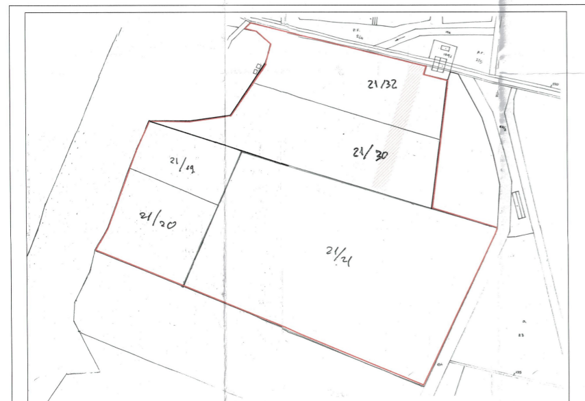
POZICIONI KADASTRAL, ZONA Nr. 1925 SHK. 1:3000 PASURIA NR. 21/19, 21/20, 21/21, 21/30, 21/32