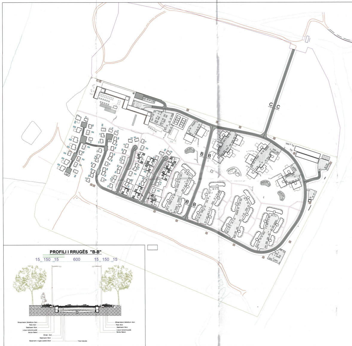
PLANI I VENDOSJES SË INFRASTRUKTURËS INXHINIERIKE SHK. 1:2000