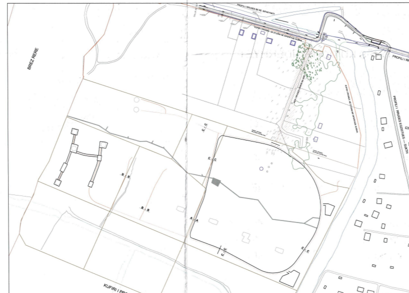
POZICIONI TOPOGRAFIK SHK. 1:3000