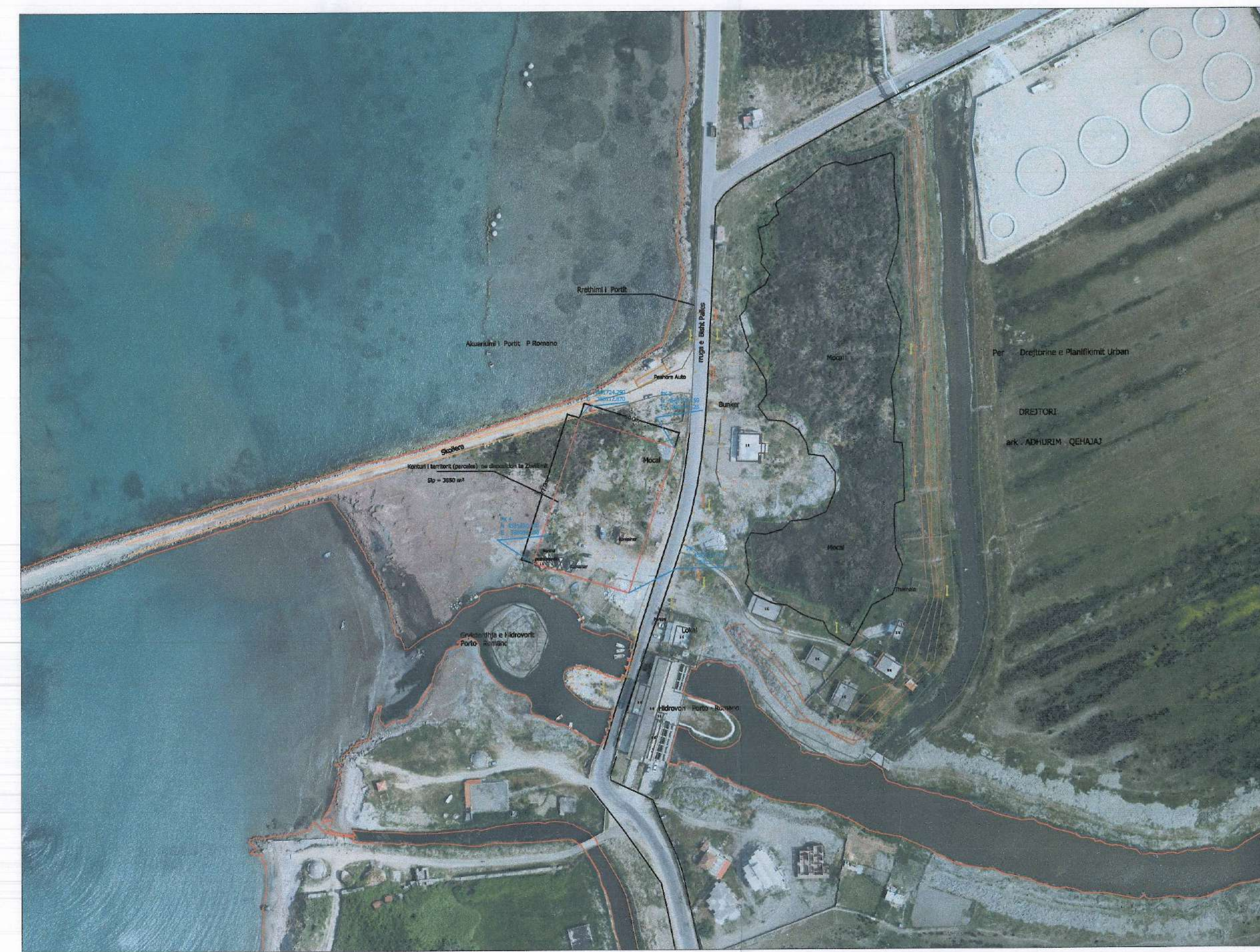
ORTOFOTO SHK. 1:2000