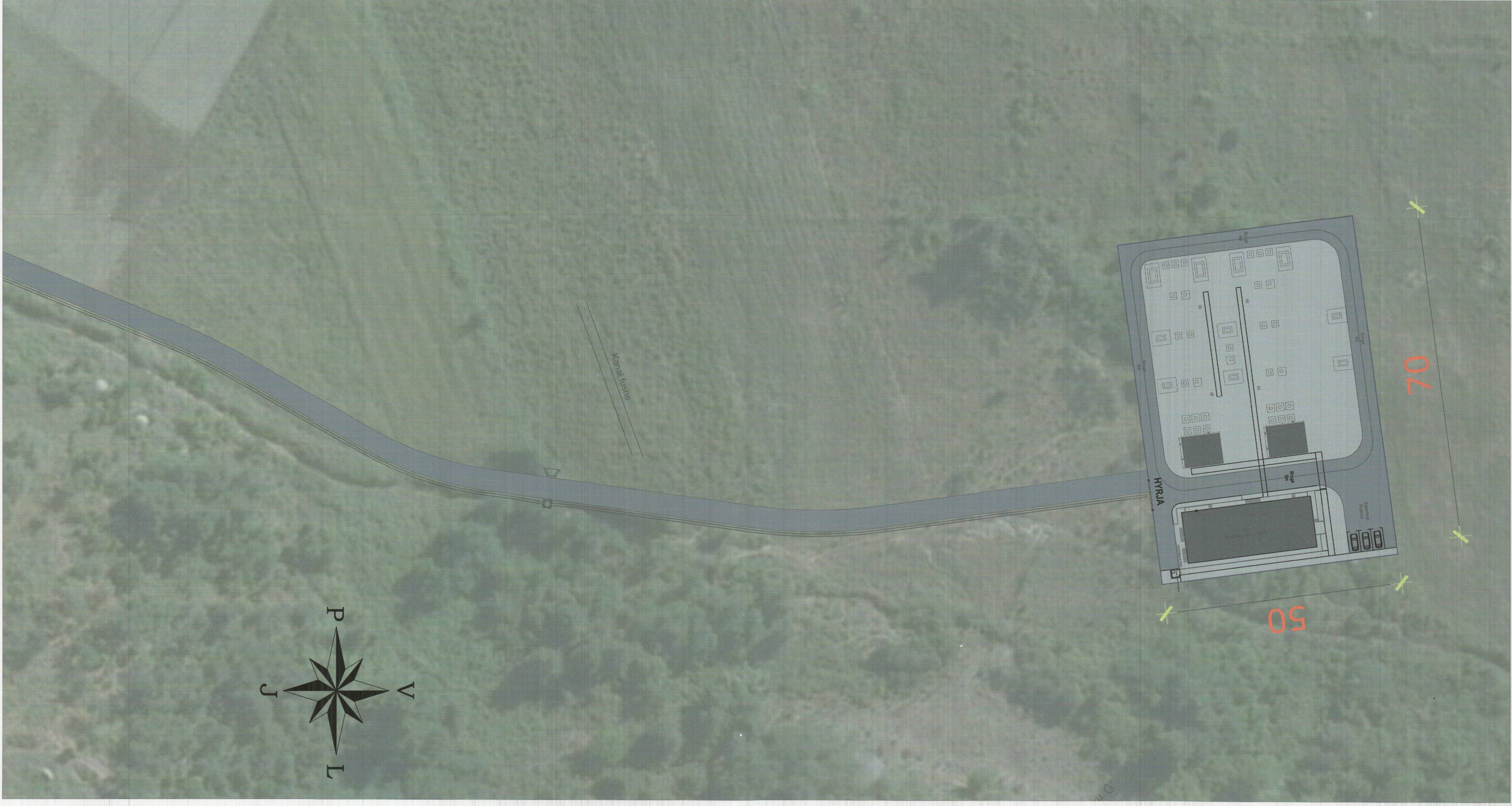
PLANI I VENDOSJES SË STRUKTURËS SHK. 1:1000