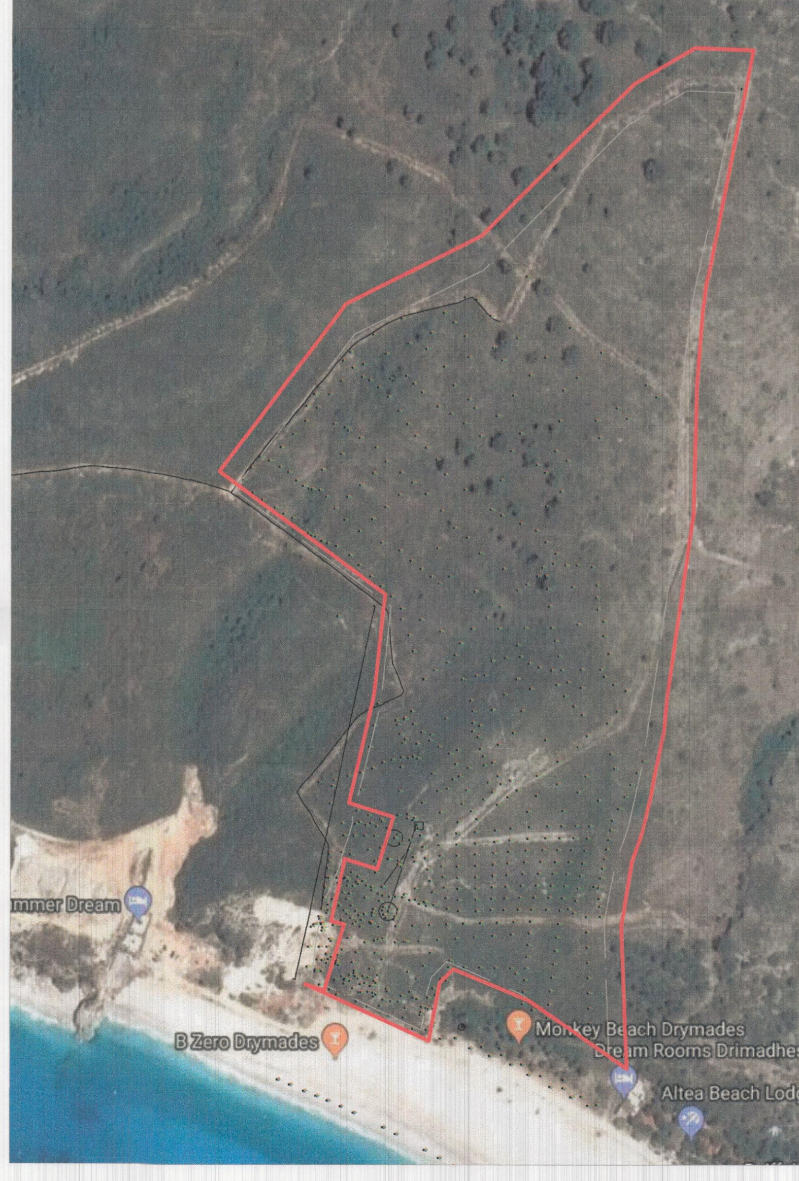
HARTA KADASTRALE SHK. 1: 3 000