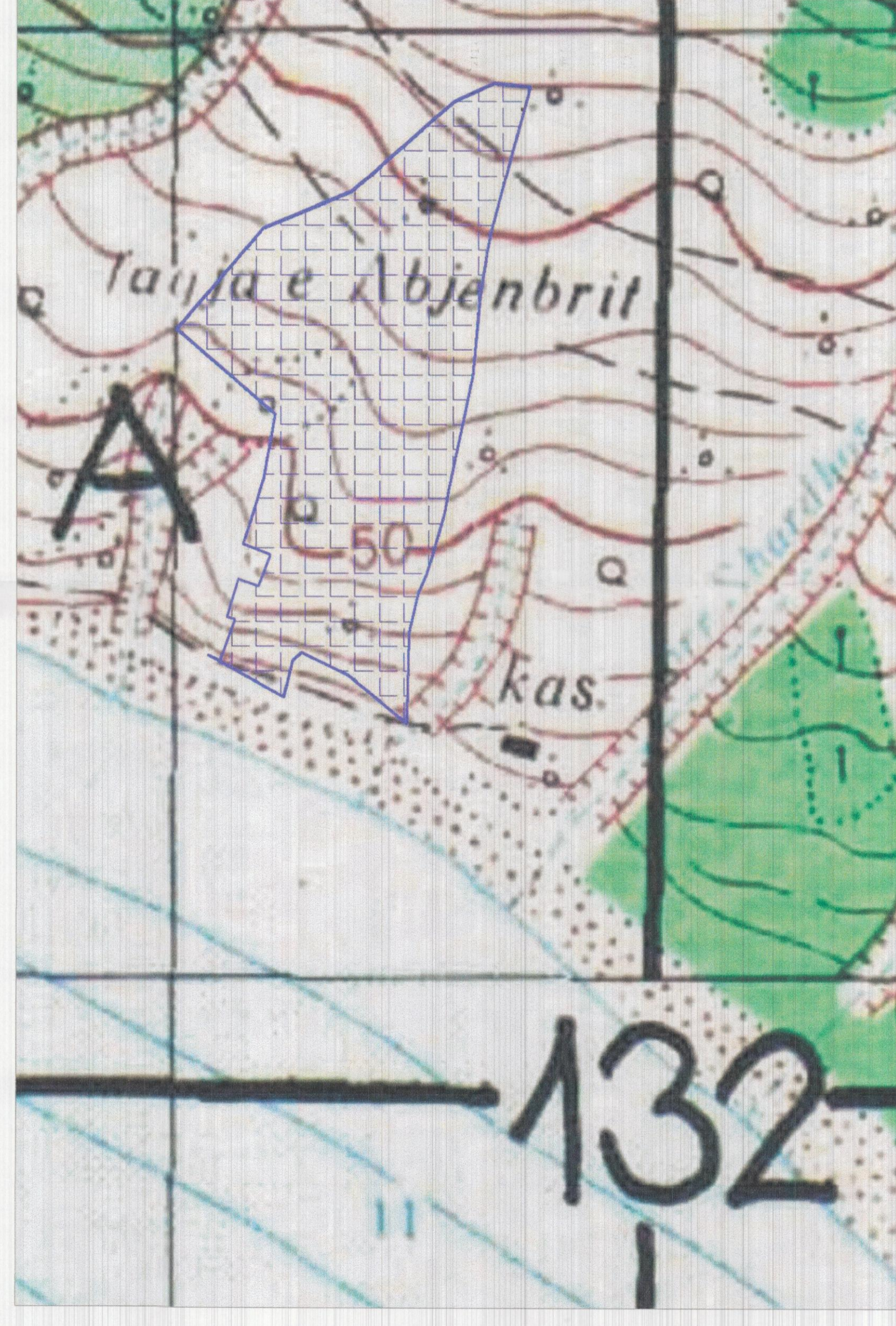
HARTA KADASTRALE SHK. 1: 3 000