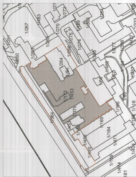
POZICIONI KADASTRAL SHK. 1:1000