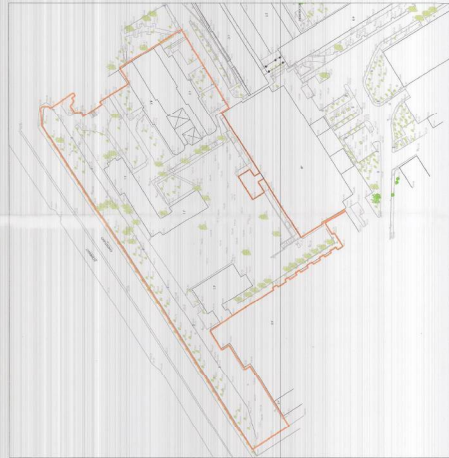
HARTA TOPOGRAFIKE SHK. 1:1000

LEGJENDE: Kufiri i truallit që do të përdoret për zhvillim Kufiri i katit mbi tokë Rrugë Trullime/sheshe Hapsire e gjerbësuar Hyje Barriere për kontroll sigurie Rempë Objekt ekzistues Parkim