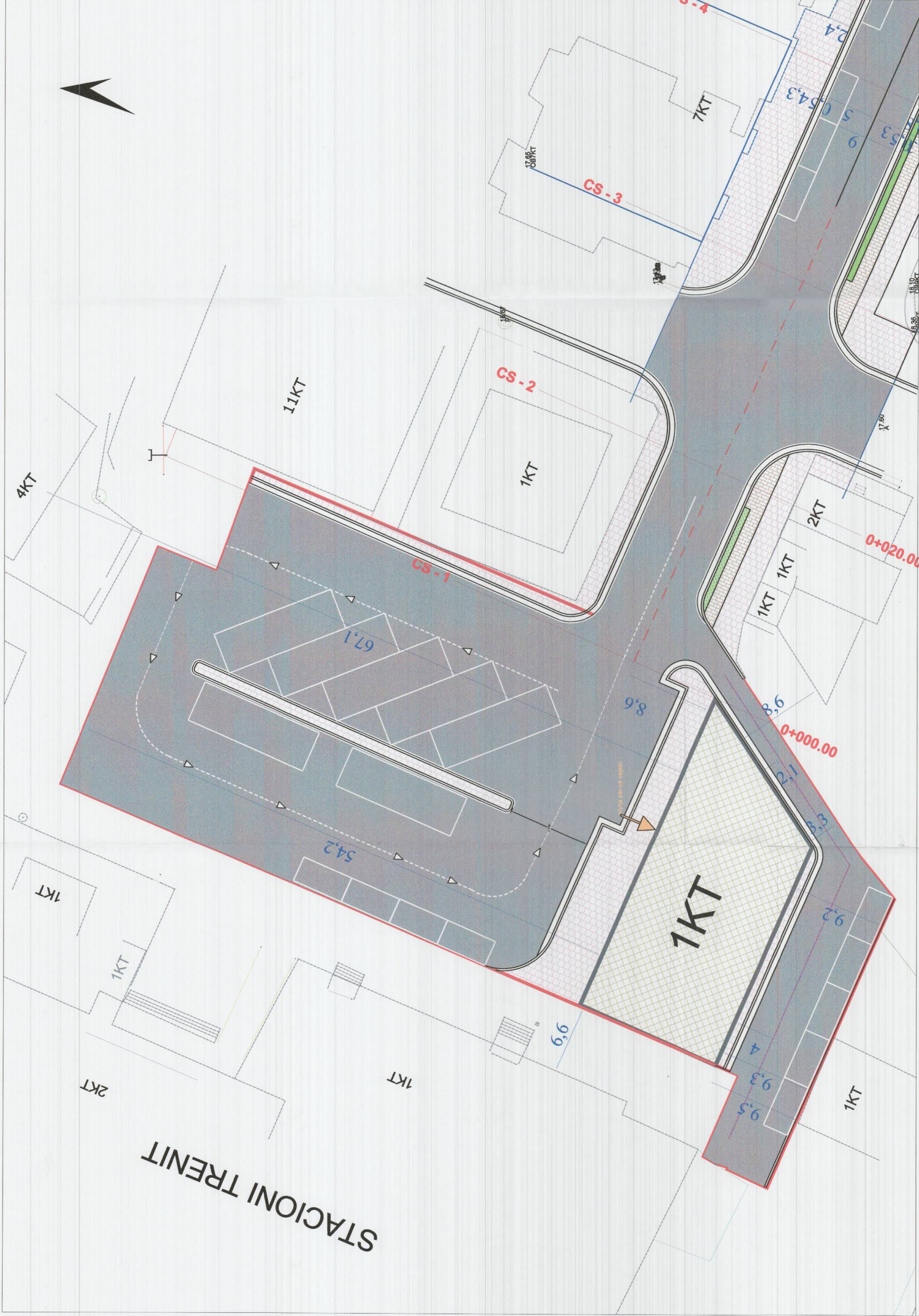
PLANI I VENDOSIES SË STRUKTURËS SHK. 1:250