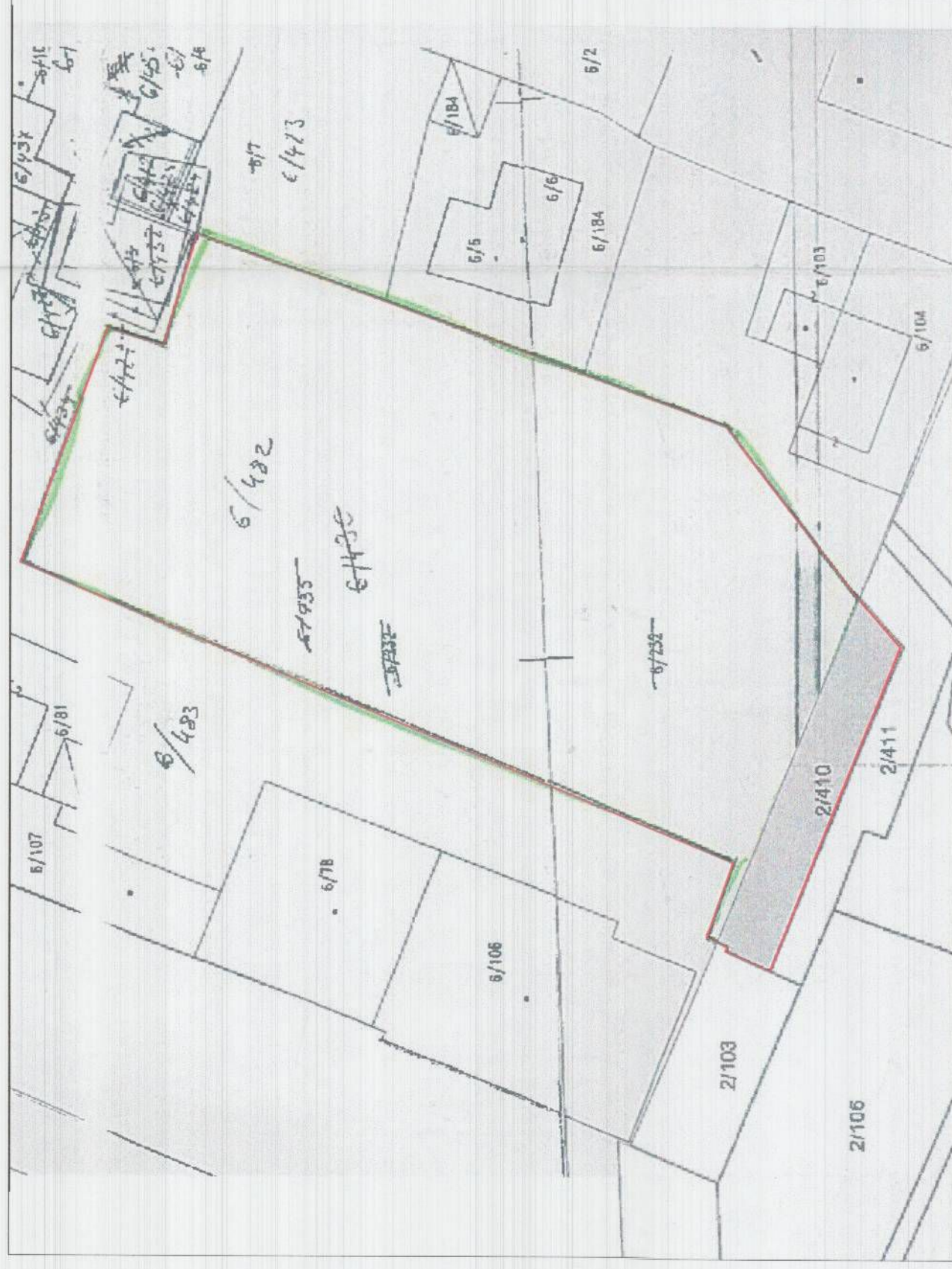
POZICIONI KADASTRAL SHK. 1:5000