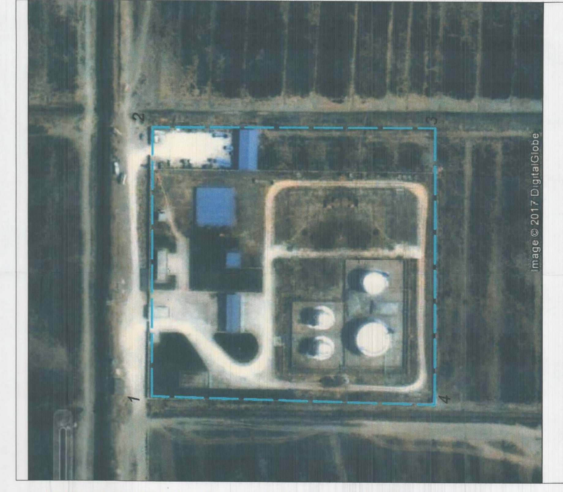
ORTOFOTO E ZONES SHK. 1:1500