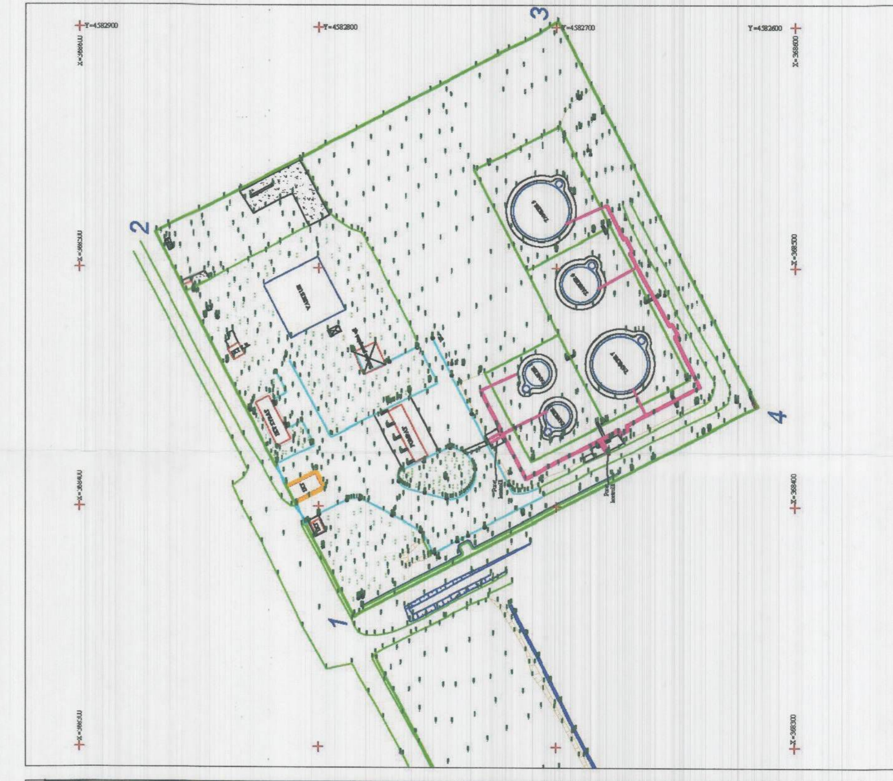
RILEVIM TOPOGRAFIK I ZONES SHK. 1:1500