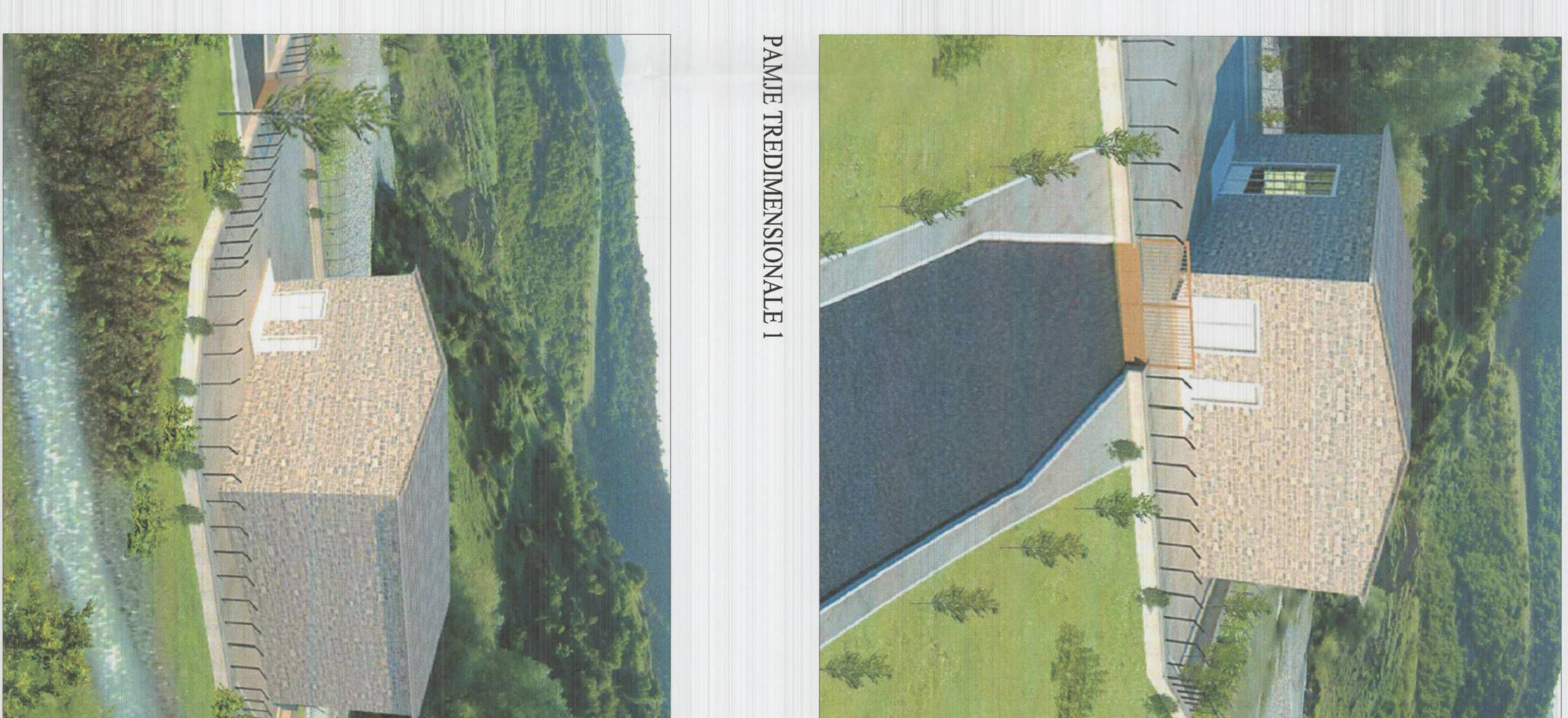
PAMJE TREDIMENSIONALE 2