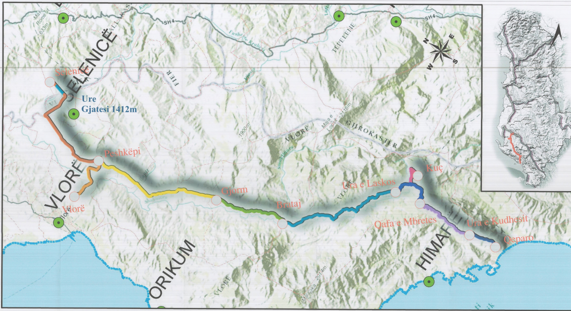
PLANI I VENDOSJES SË STRUKTURËS SHK. 1: 10000 (Shkalla sipas rrethit: 1:500; 1:1000; 1:5000; 1)