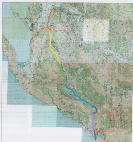
HARTA TOPOGRAFIKE SHK. 1:250000

TREGUESIT E ZHVILLIMIT: KATEGORIA: C2 GJERRESIA E KURORRES: 8.5M PIERRESIA MAXIMALE GJATESORE: 7%