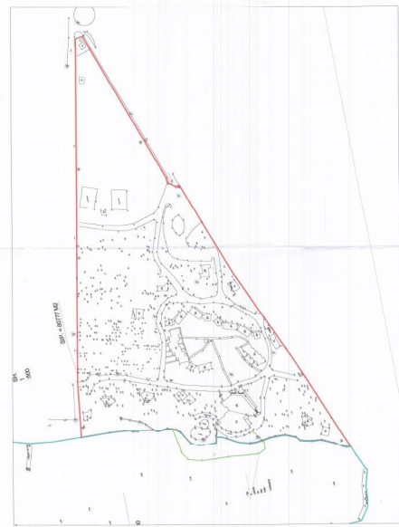
HARTA TOPOGRAFIKE SHK. 1:2000