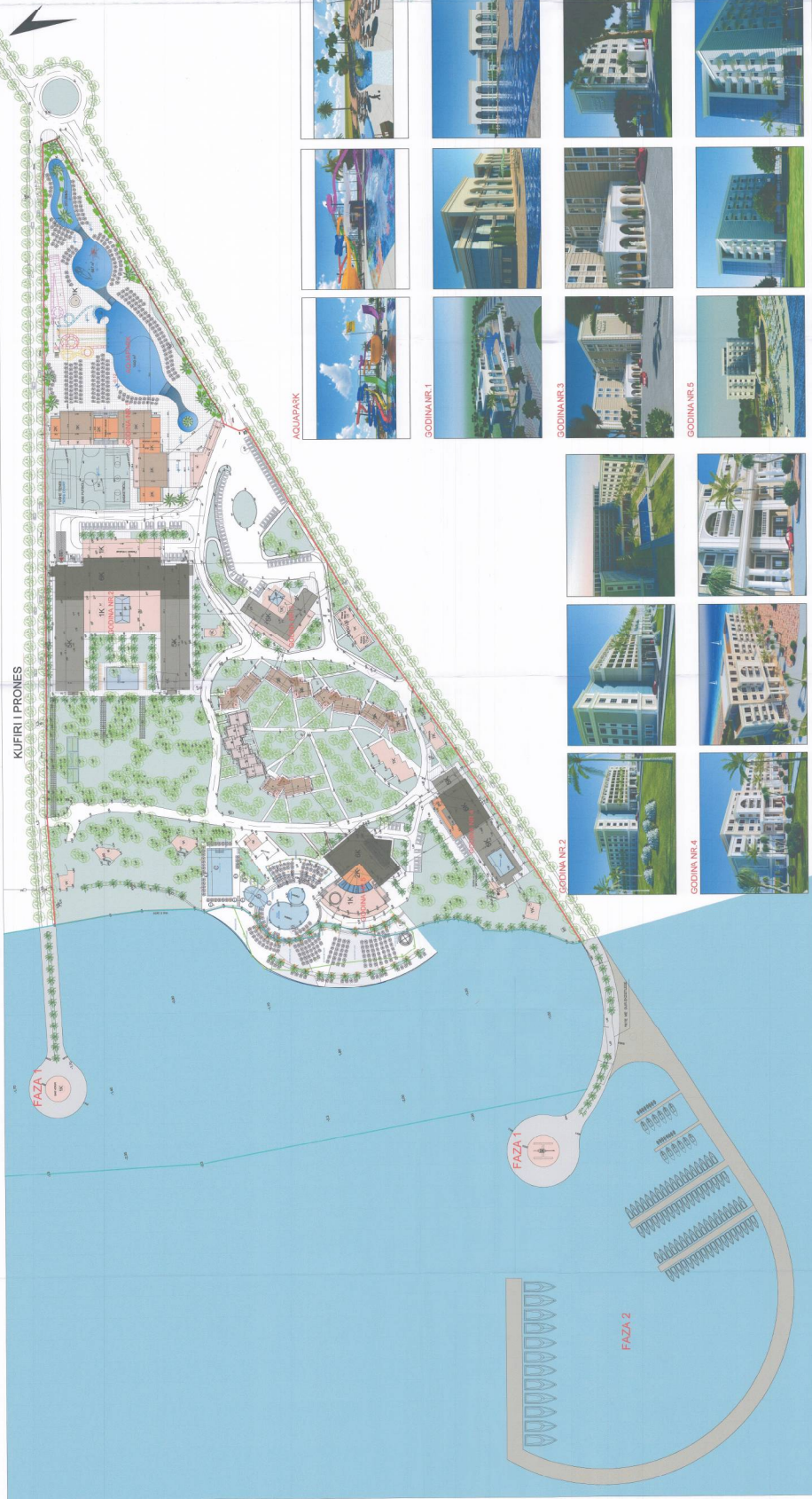
PLANI I VENDOSJES SË STRUKTURËS SHK. 1:1000