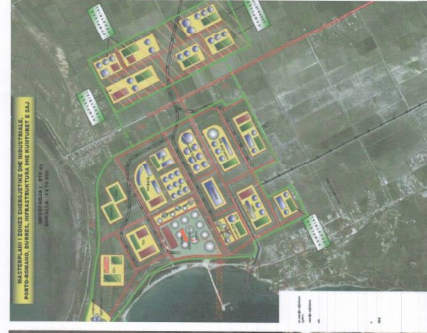
MASTERPLANI I ZONËS ENERGETIKE INDUSTRIALE PORTO ROMANO SHK. 1:25000

TREGUESIT E ZHVILLIMIT: Sipërfaqe e përgjithshme e truallit: 7000m 2 Sipërfaqe e truallit që përdoret për zhvillim: 7000m 2 Sipërfaqe e përgjithshme e ndërtimit: 1820m 2 Koeficienti i shfrytëzimit të truallit për ndërtim: 20% Sipërfaqe përdorues: 200m 2 Sipërfaqe shfrytëzues: 250m 2 Koeficienti i shfrytëzimit të truallit për rrugë dhe hapësira publike: 46.5% Lartësia maksimale e strukturës nga niveli i kësulës së sistemit: 14.83m Intensiteti i ndërtimit: 1.74 Numri i katëve mbi tokë: 2 Numri i katëve nën tokë: 2