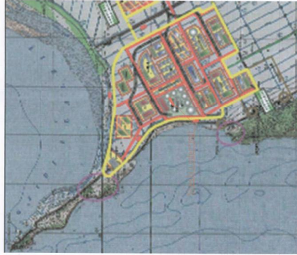
HARTA TOPOGRAFIKE SHK. 1:25000