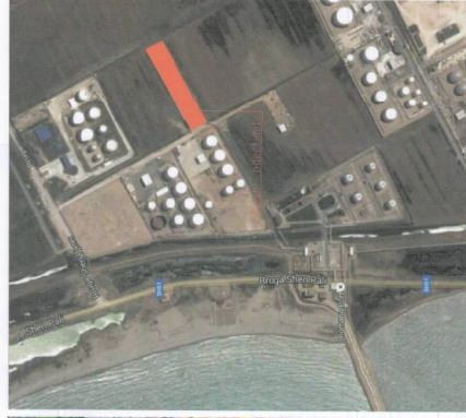
ORTOFOTO E ZONËS NË STUDIM SHK. 1:5000