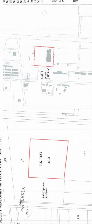
POZICIONI KADASTRAL SHK. 1:2500 Zona kadastrale nr.3183; Nr. i pasurisë: 2012