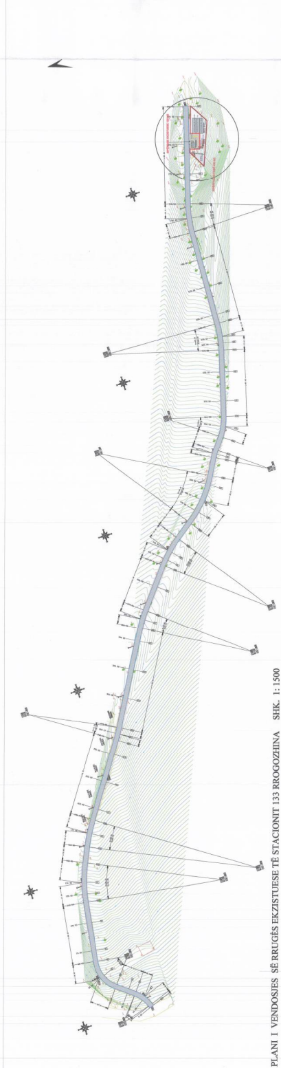
PLANI I VENDOSJES SË RRUGËS EKZISTUESE TË STACIONIT 133 RROGOZHINA SHK. 1:1500