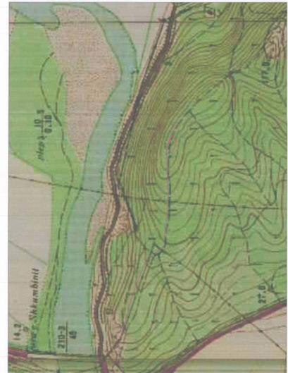
HARTA TOPOGRAFIKE SHK. 1:5000