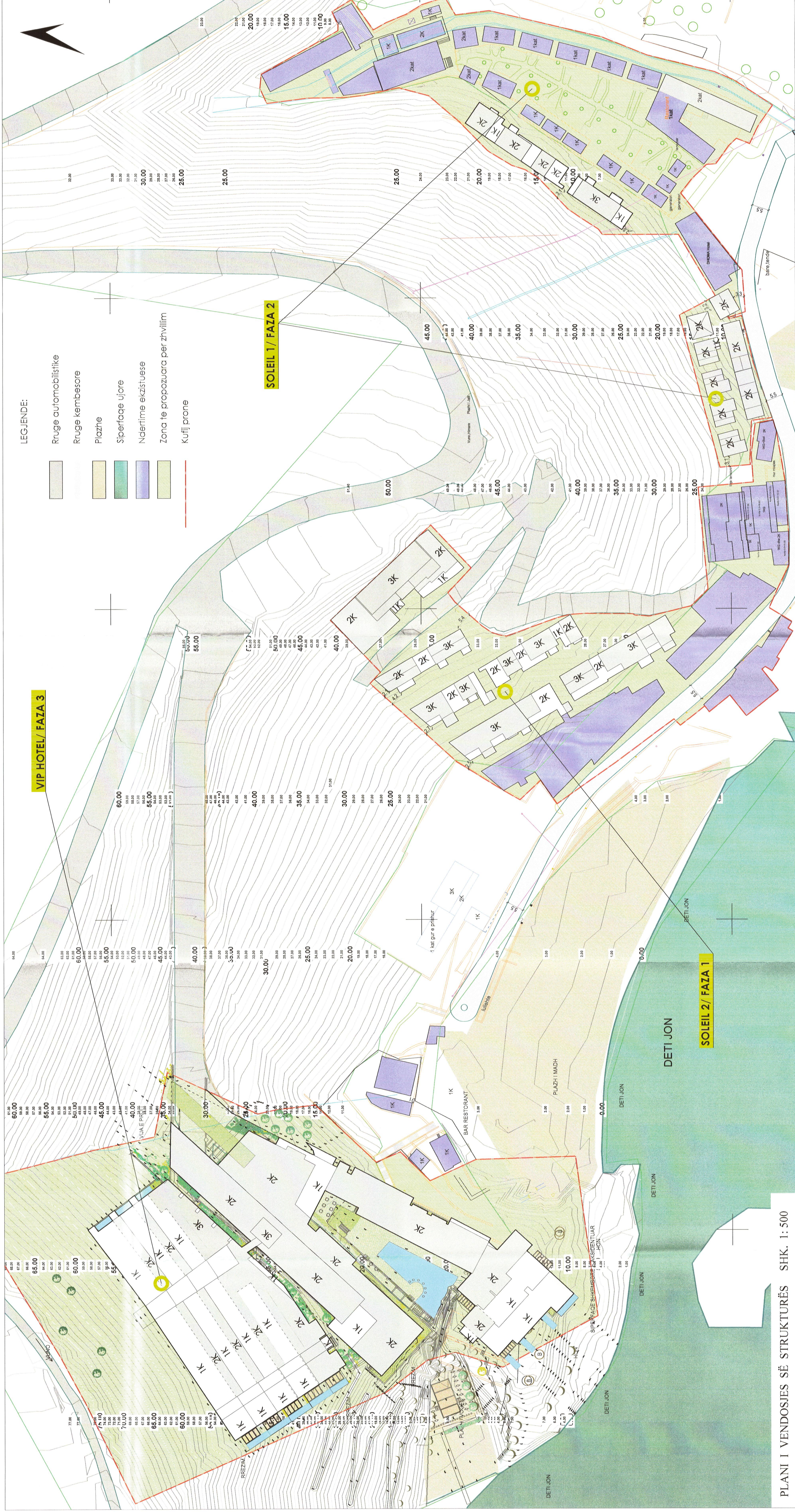
PLANI I VENDOSJES SË STRUKTURËS SHK. 1: 500