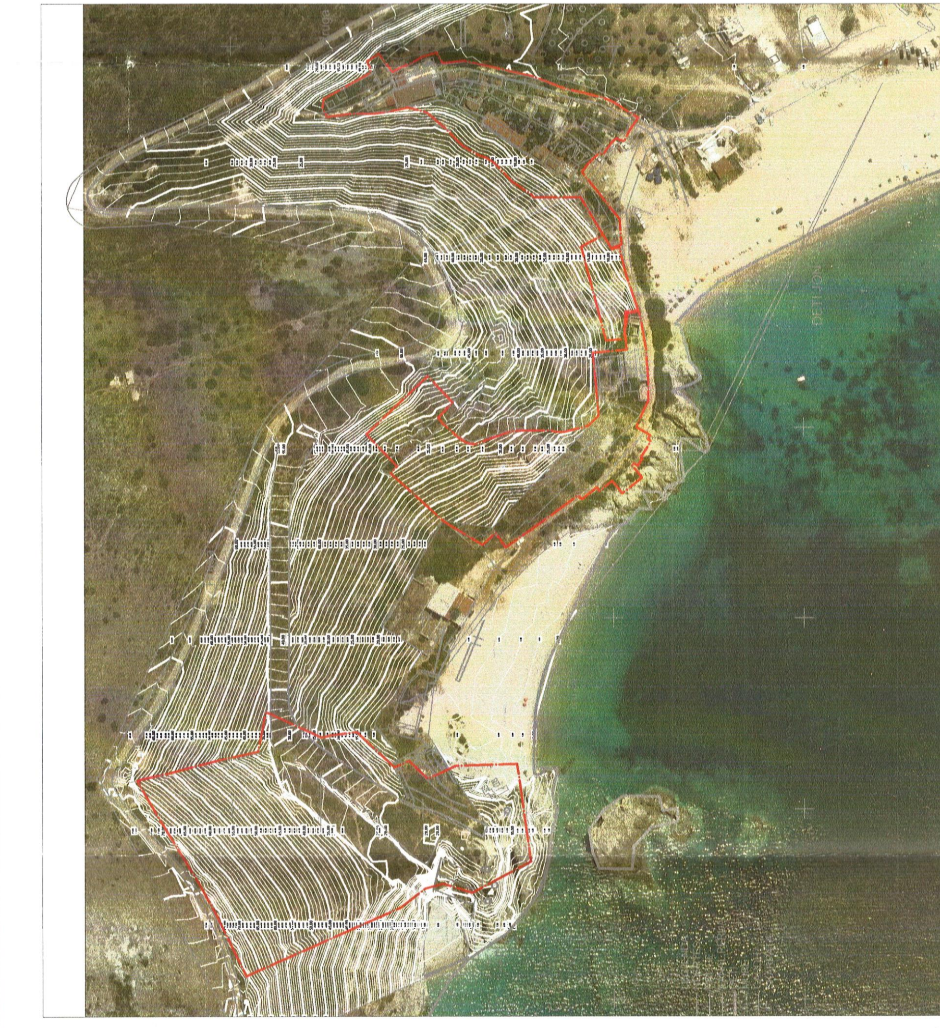
HARTA TOPOGRAFIKE SHK. 1:2000