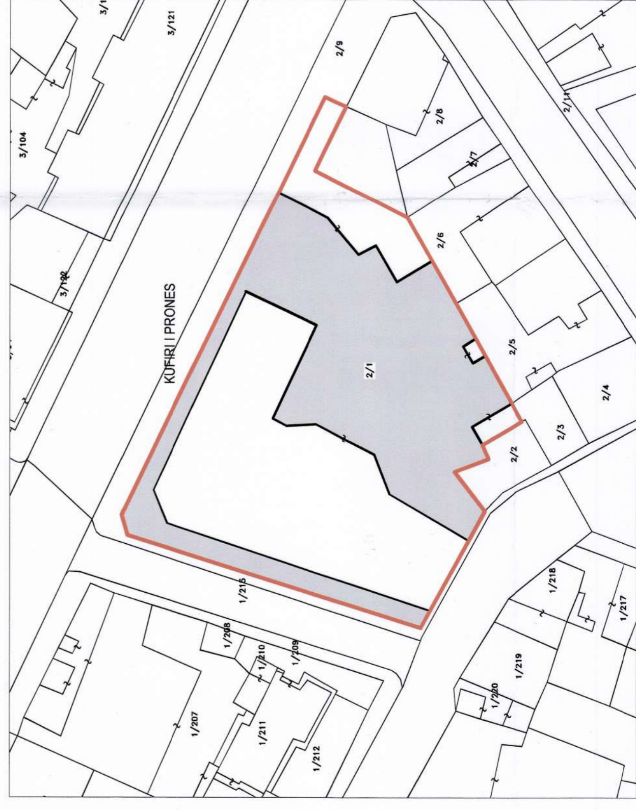
POZICIONI KADASTRAL SHK. 1: 500