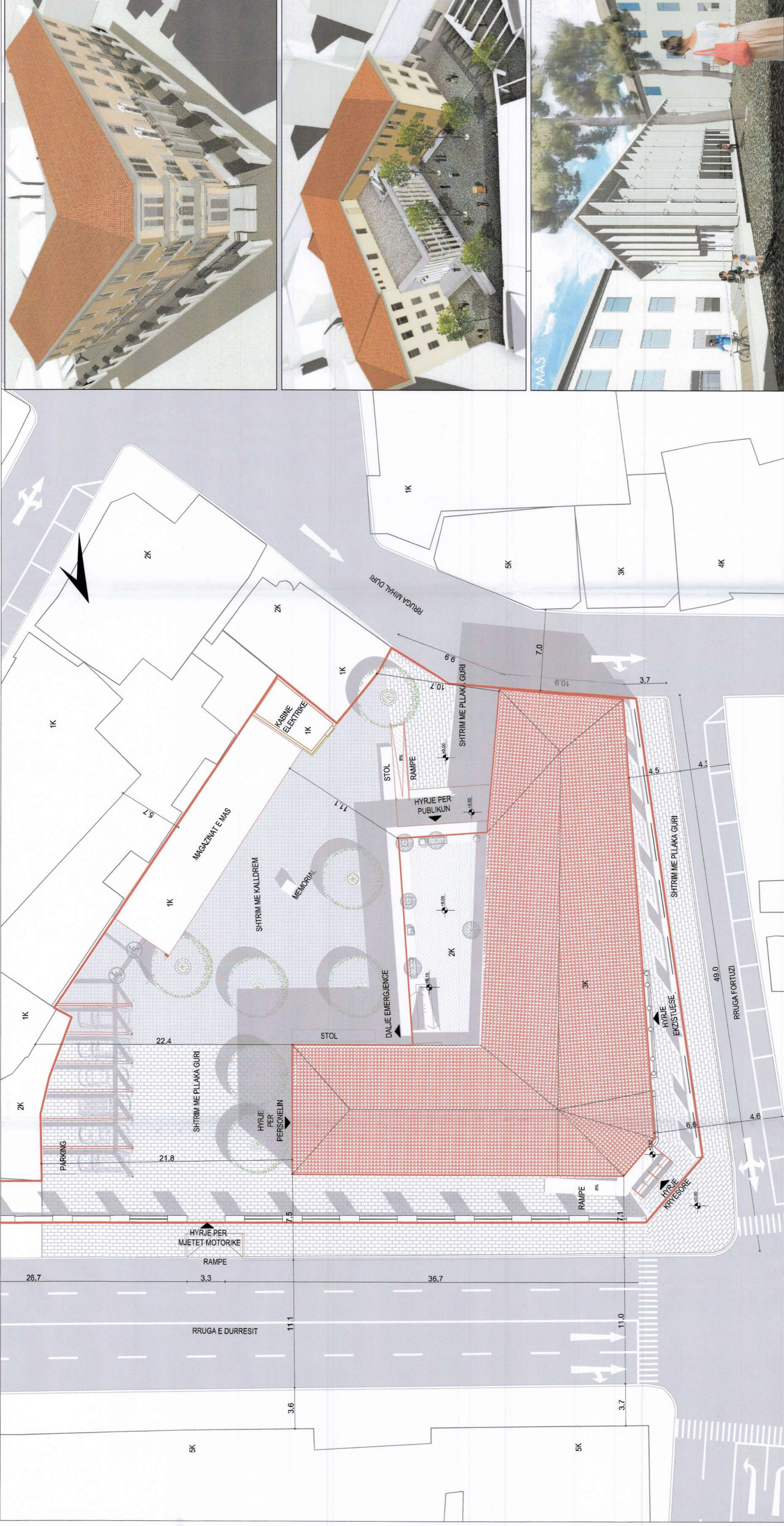
PLANI I VENDOSJES SË STRUKTURËS SHK. 1: 200