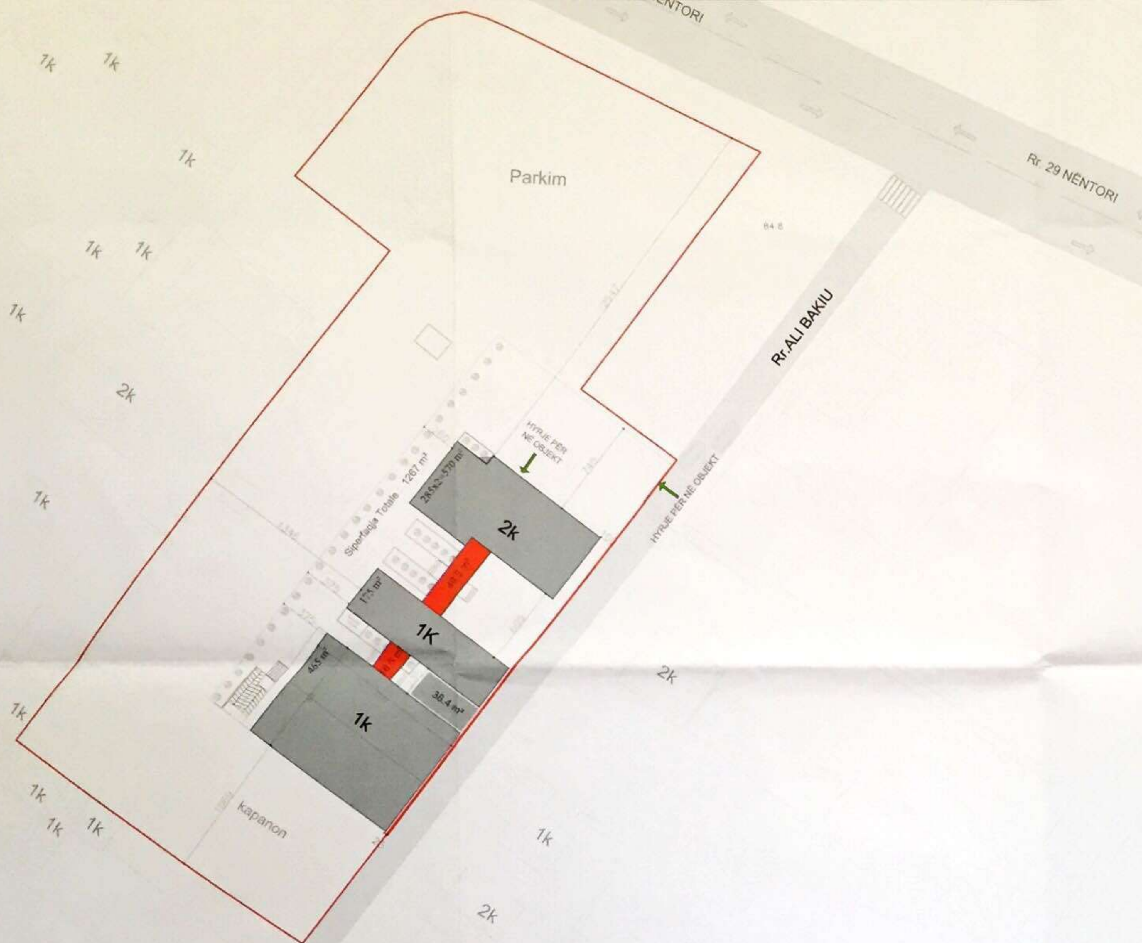
PLANII I VENDOSJES SE STRUKTURES SHK - 1:200