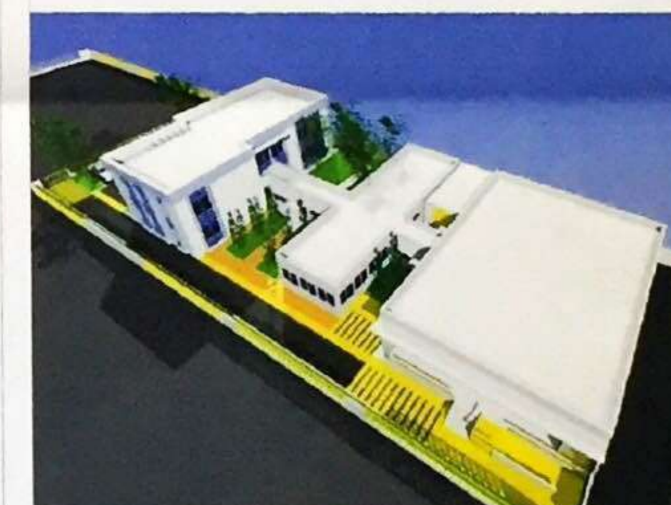
IMAZHET 3D TË OBJEKTIT : "RIKONSTRUKSION I LABORATORIT DOGANOR