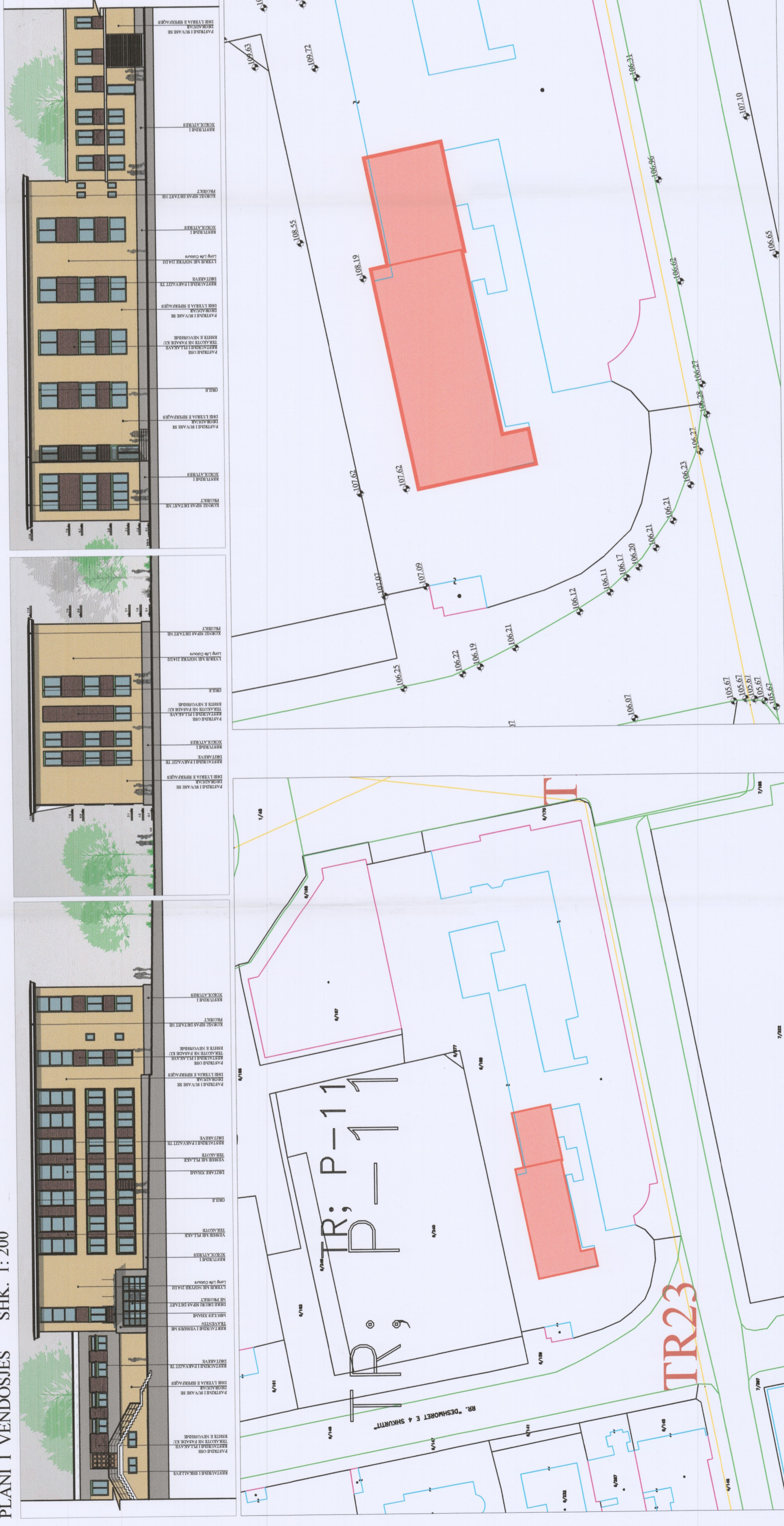
POZICIONI KADASTRAL SHK. 1:1000