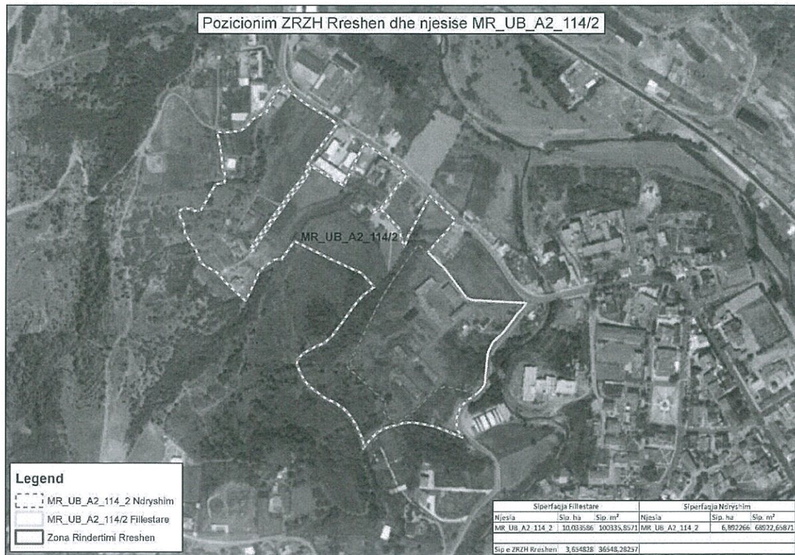
Harta 1 - Harta e njësive strukturore të tjera që pësojnë ndryshime

Në hartat mëposhtë ilustrohen njësitë strukturore të Planit të Përgjithshëm Vendor Bashkia Mirditë, të cilat pësojnë ndryshime sipas Kreut II të këtij dokumenti.