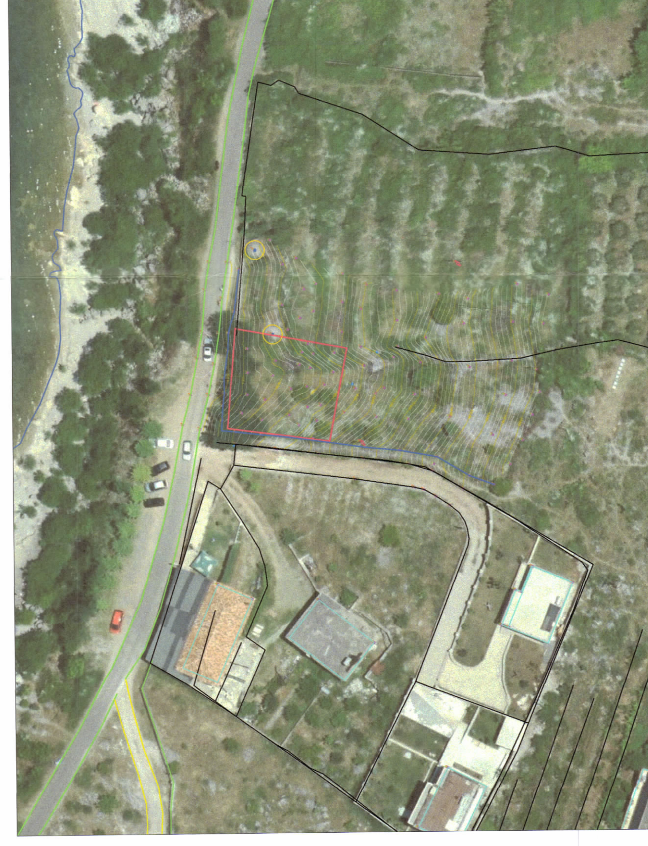
HARTA TOPOGRAFIKE SH:1:500