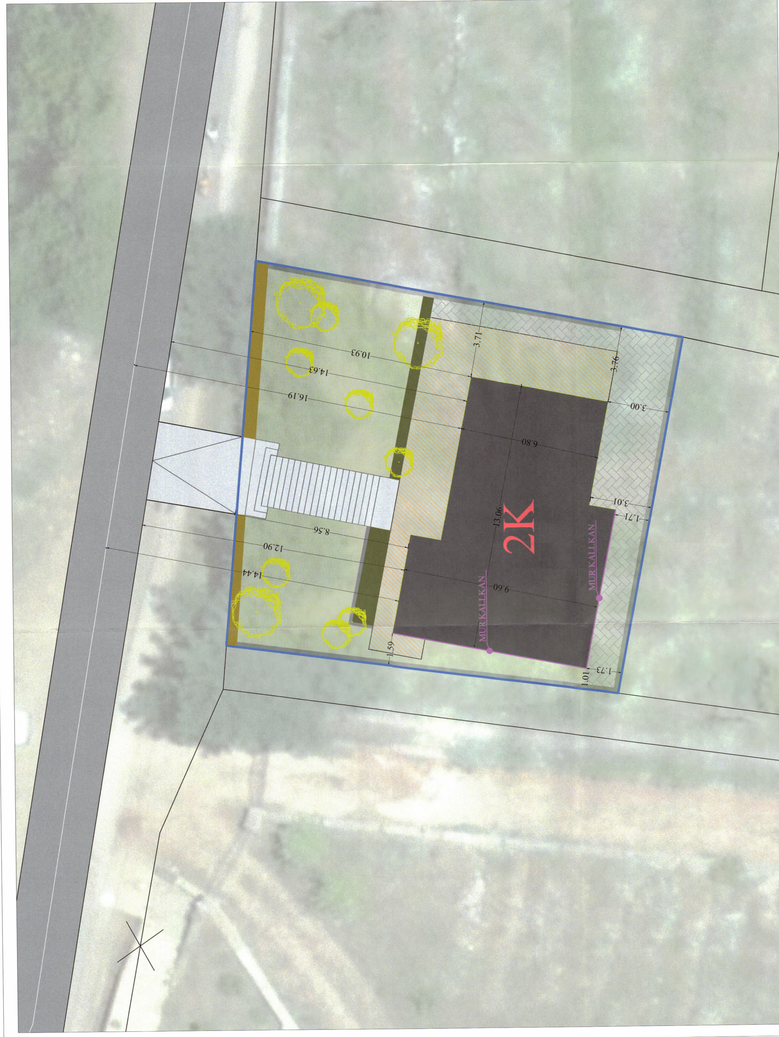
PLANI I VENDOSJES TE STRUKTURAVE SH:1:75

Faqe muri pa çarje në fasadë PERENDIM (kallkan)