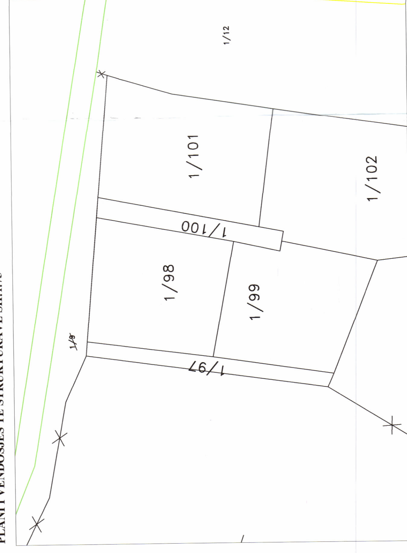
POZICIONI KADASTRAL I:250