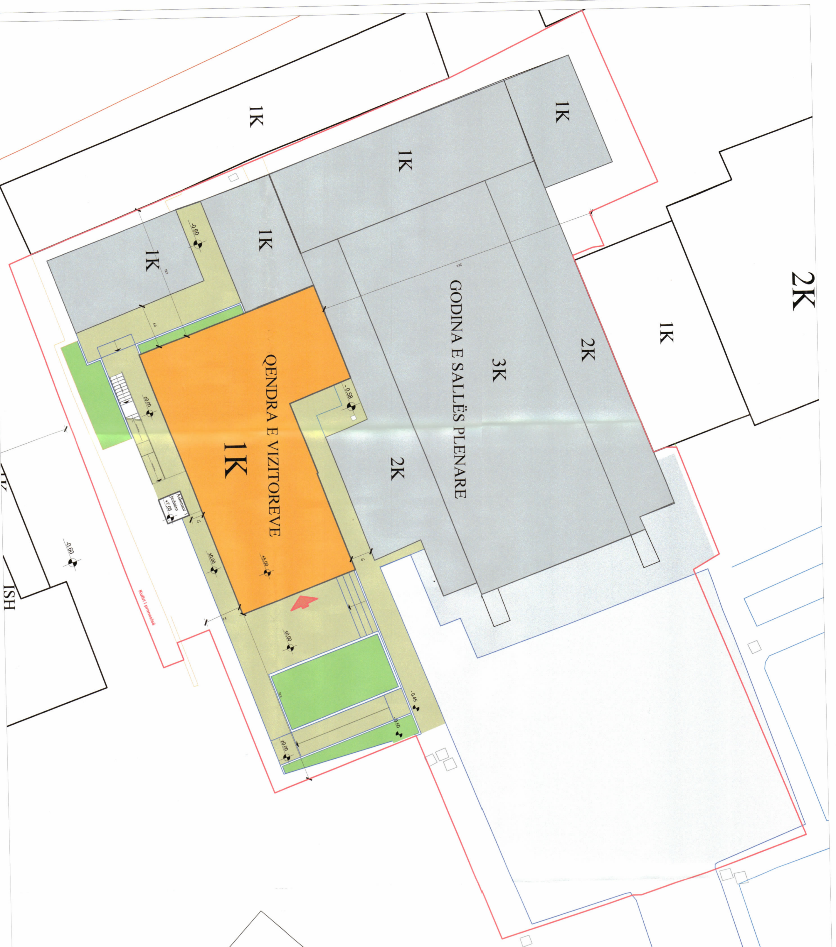
PLANI I VENDOSJES SË STRUKTURËS SHK. 1:500