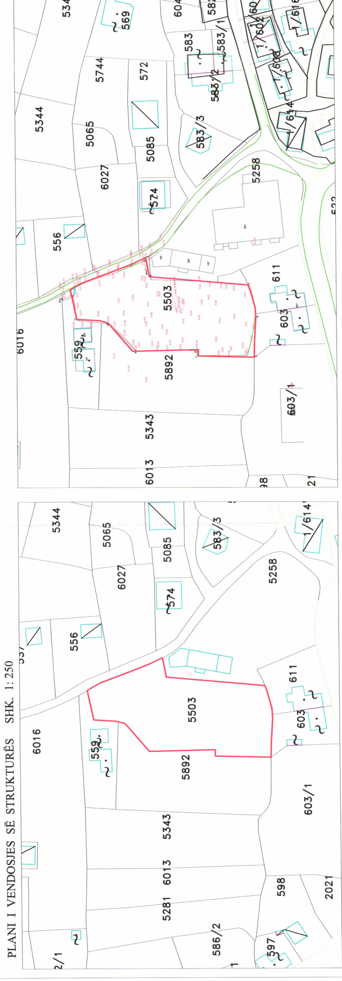
PLANI I VENDOSJES SË STRUKTURËS SHK. 1: 250