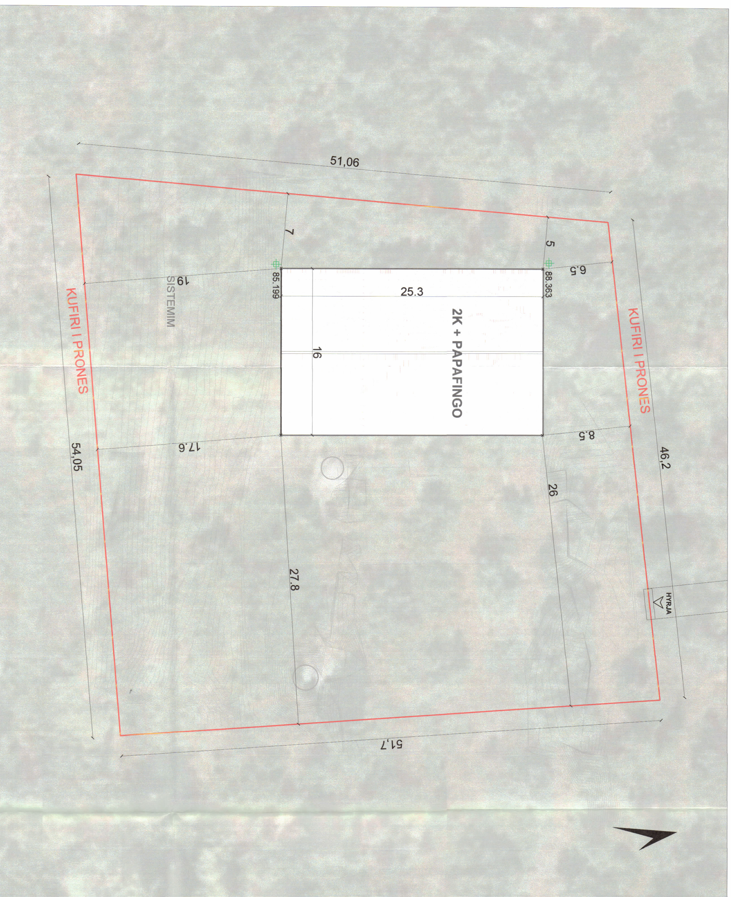
PLANI I VENDOSJES SË STRUKTURËS SHK. 1: 200

TREKUESI TEKNIK: Nr. pasurie dhe Zona Kadastreale: NR PASURIE 68 / 320 ZK 1739 Distanca nga kufiri i pronës: 6.5m 8.5m Vlerë: 19m 17.6m Jug: 26m 27.8m Lindje: 5m 7m Perëndim: 5m 7m