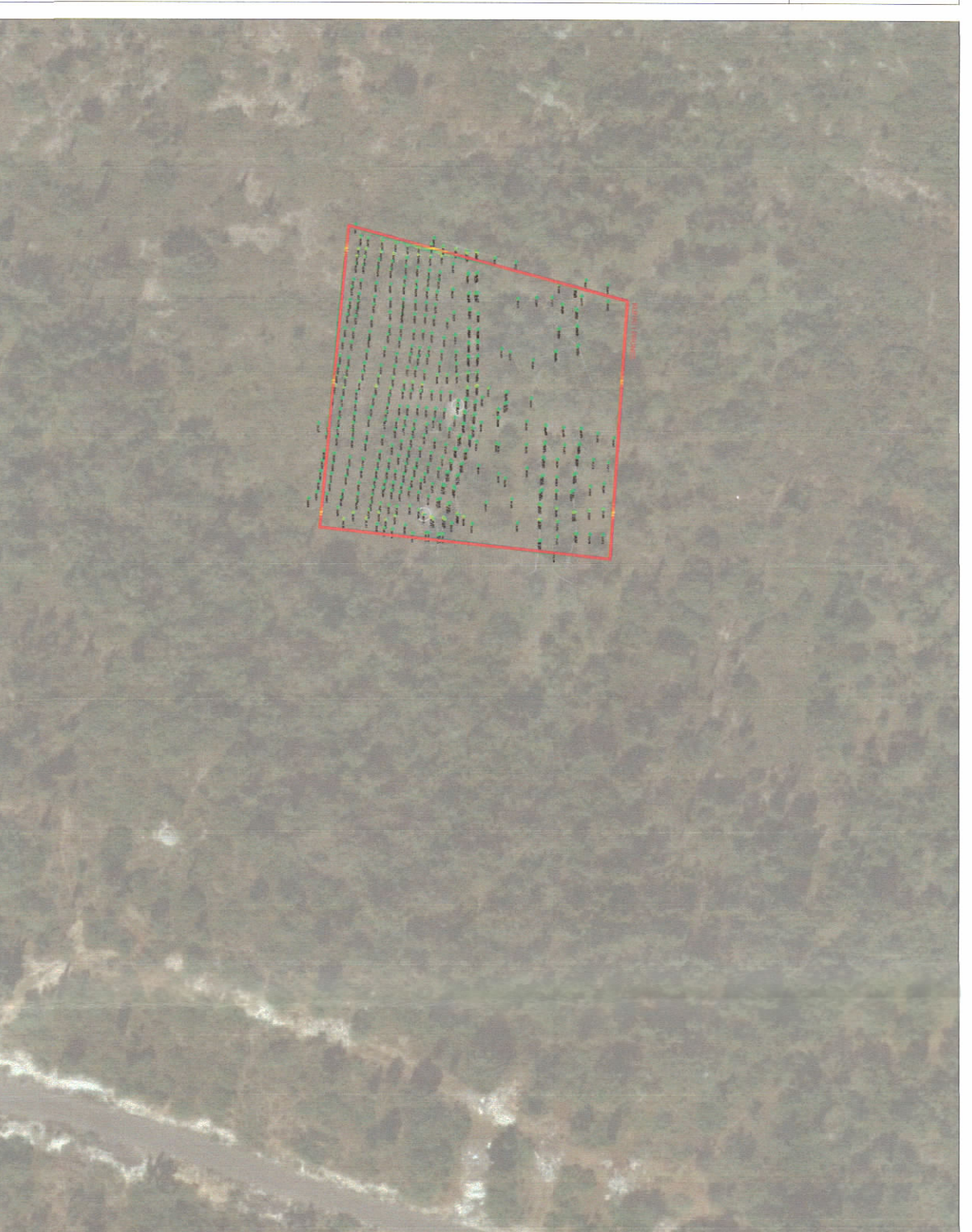
HARTA TOPOGRAFIKE SHK. 1:1000