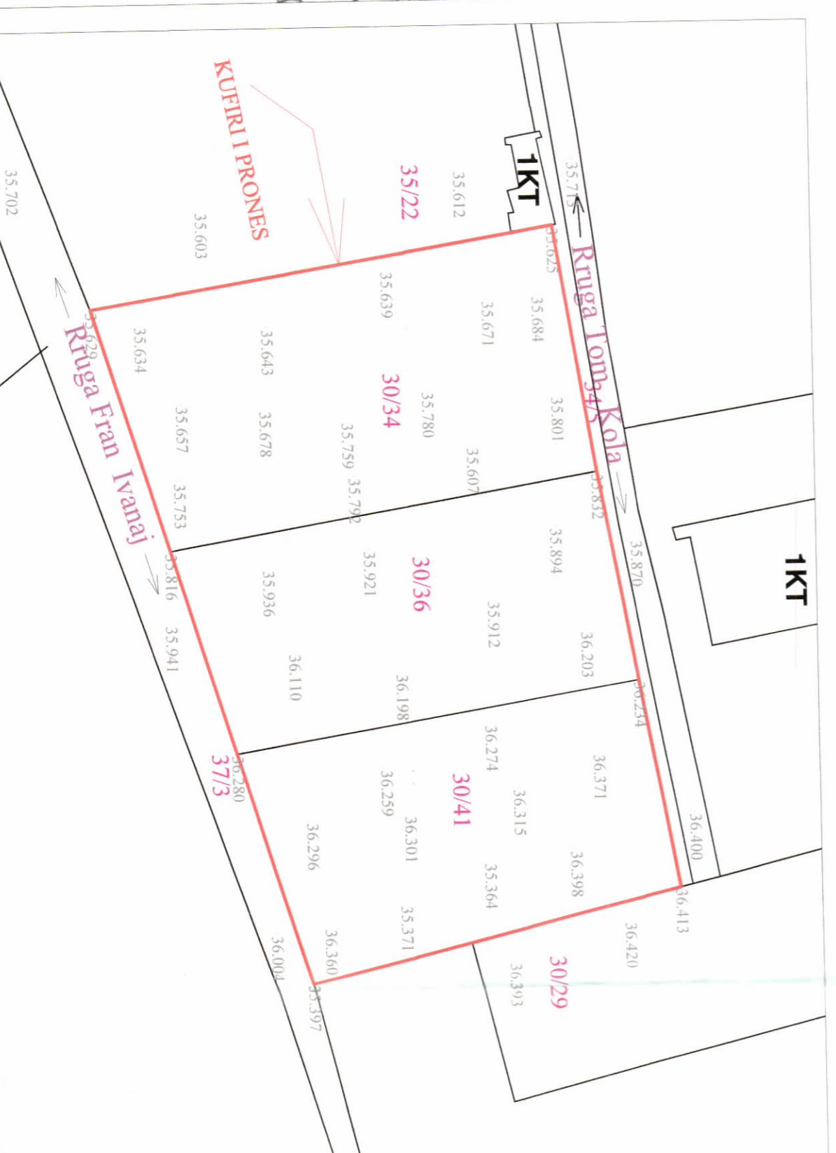
HARTA TOPOGRAFIKE SHK. 1:500

Miratur me Vendim të KKT Nr. 39, Datë 17/03/2021