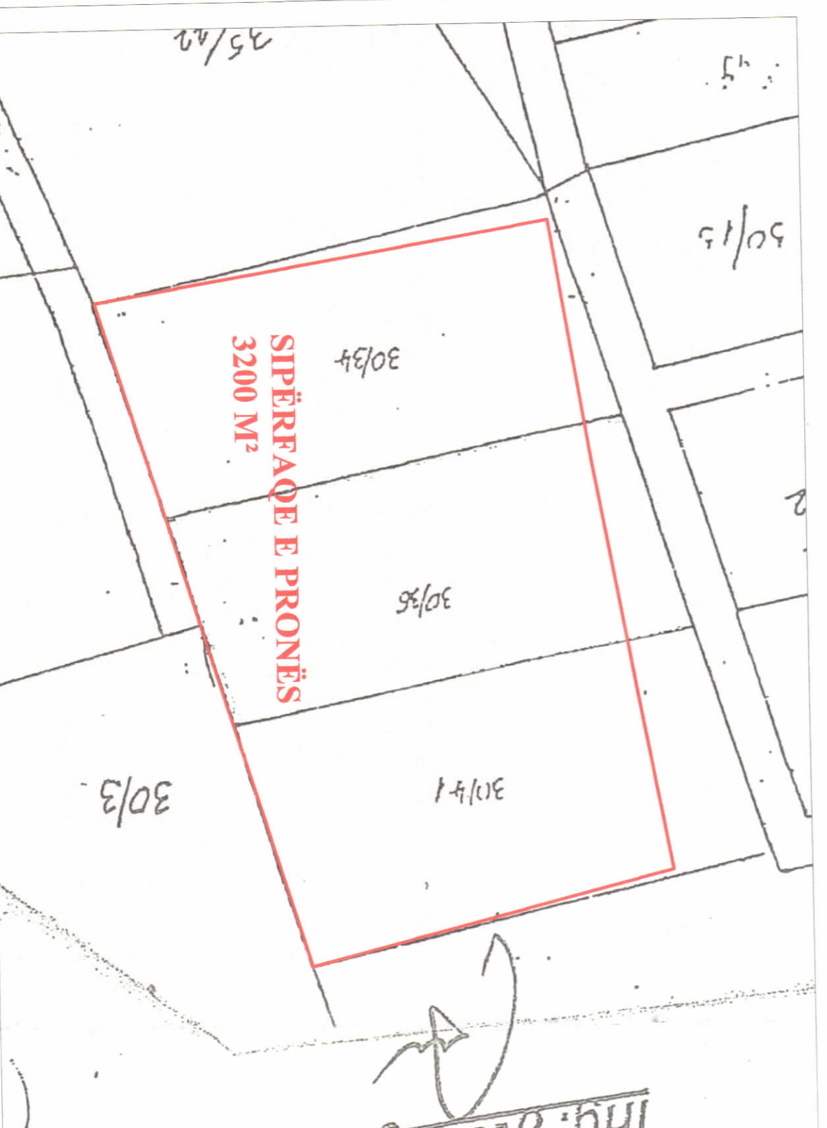
POZICIONI KADASTRAL SHK. 1:500