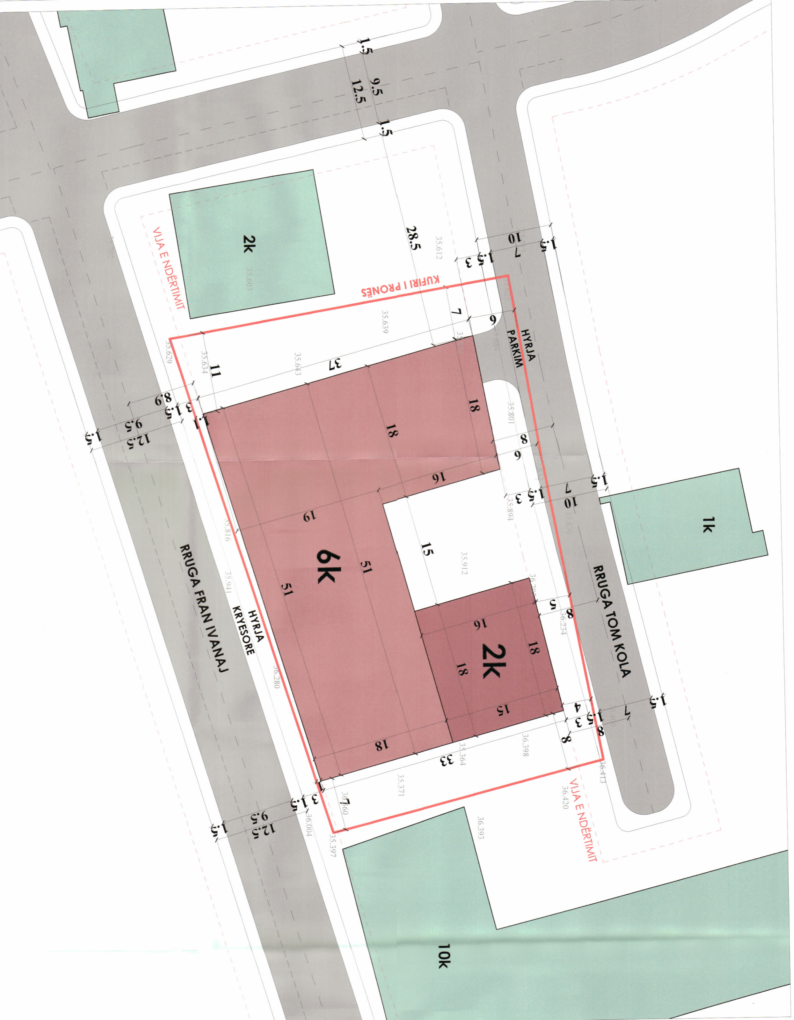
PLANI I VENDOSIES SË STRUKTURËS SHK. 1:300