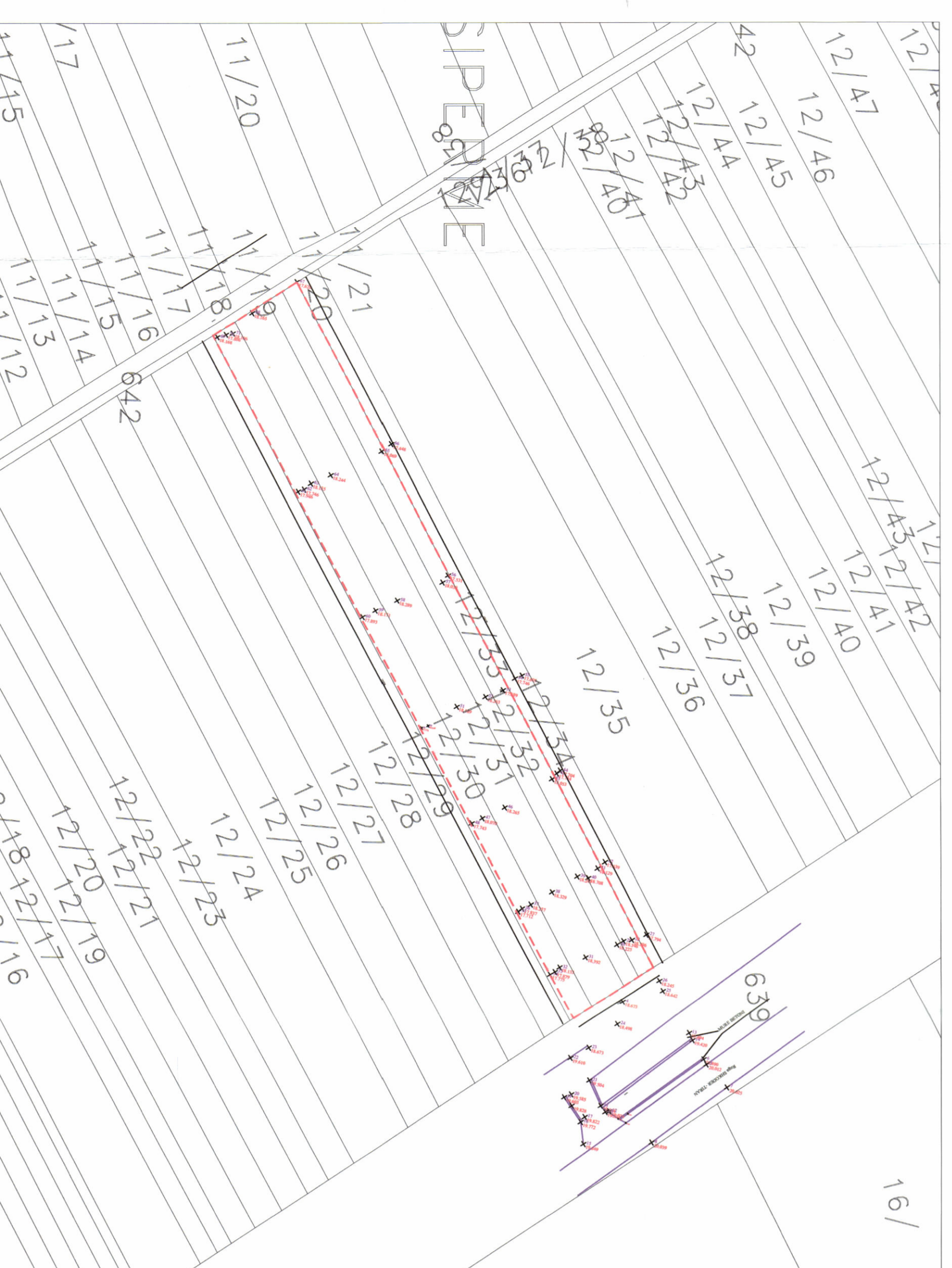
POZICIONI KADASTRAL SHK. 1:2000