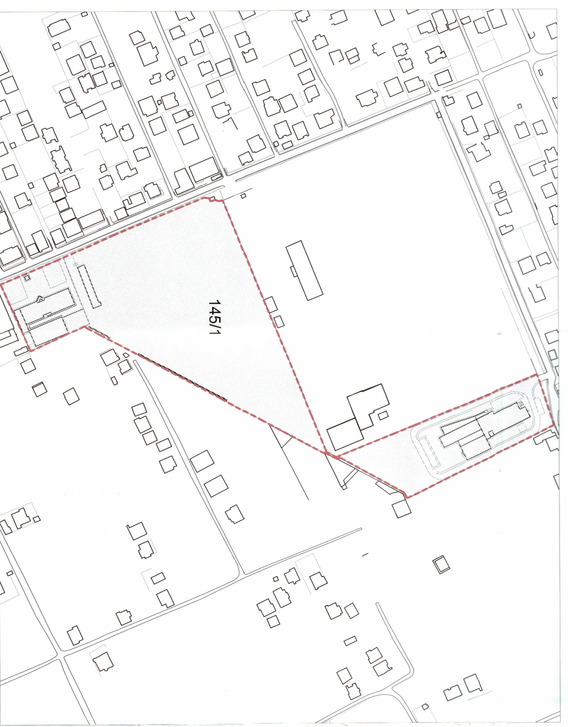
POZICIONI KADASTRAL SHK. 1:2000