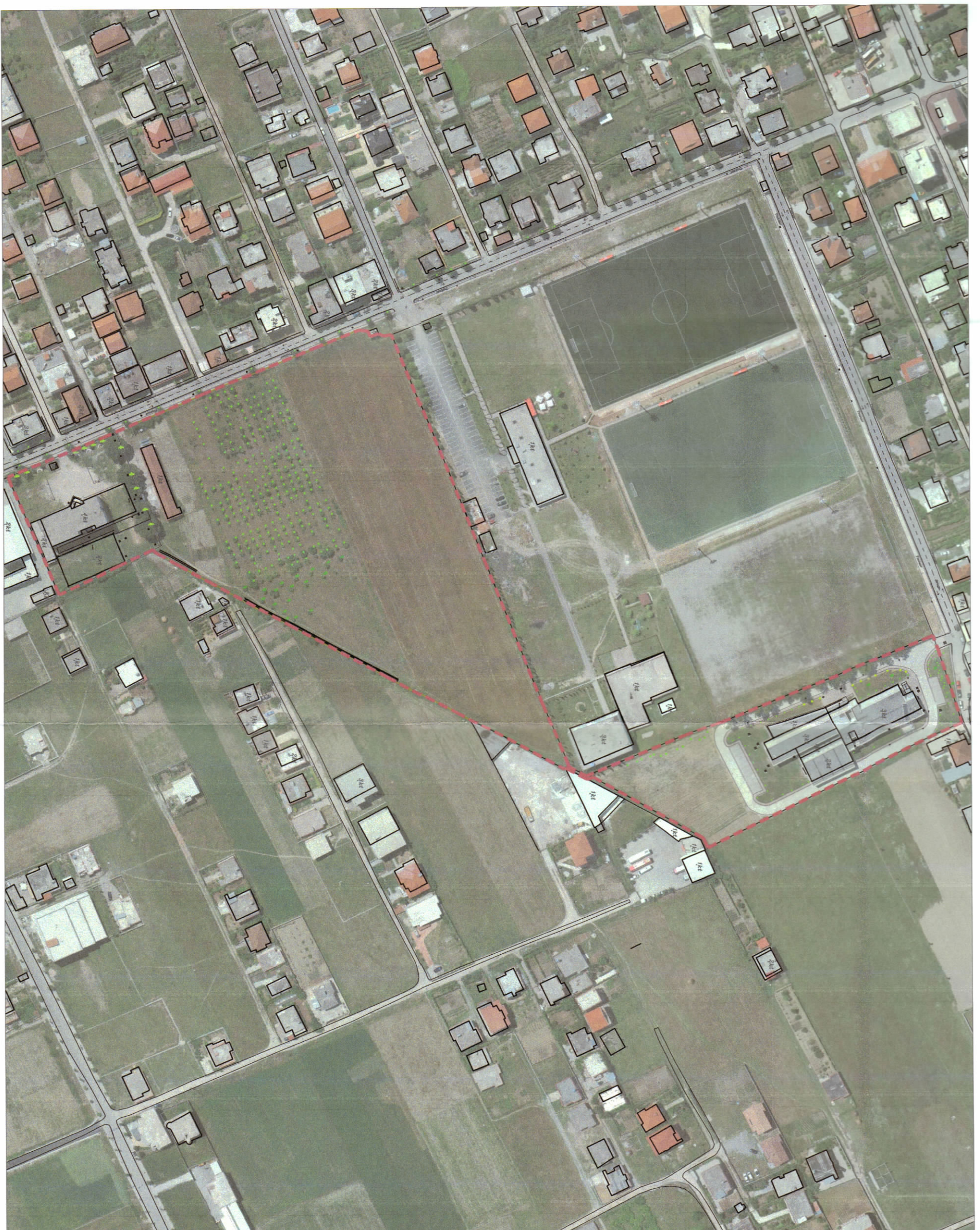
HARTA TOPOGRAFIKE SHK. 1:2000