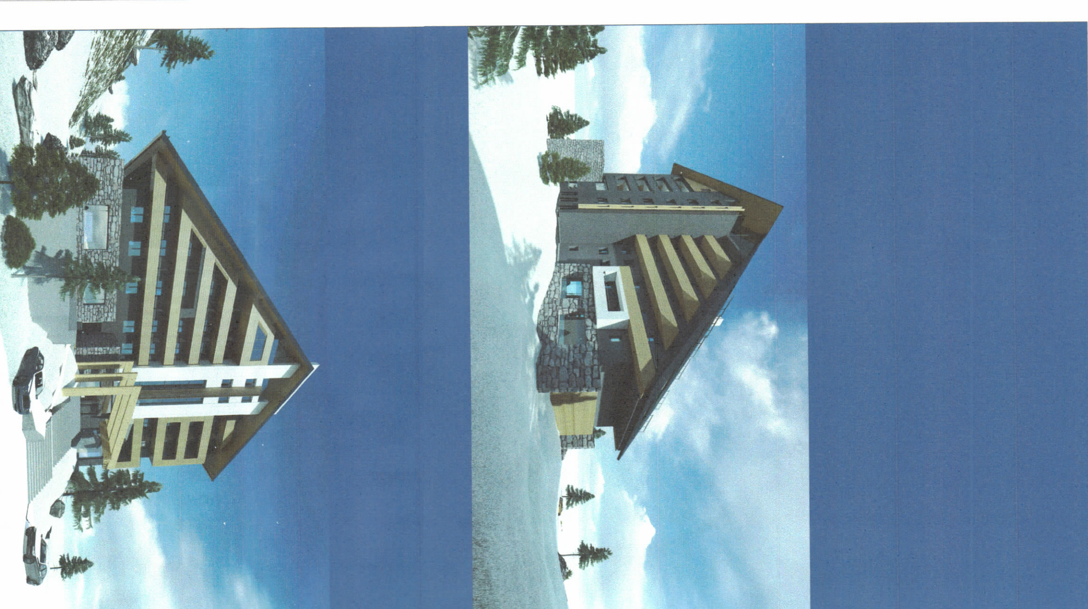
PAMJE TRE DIMENSIONALE