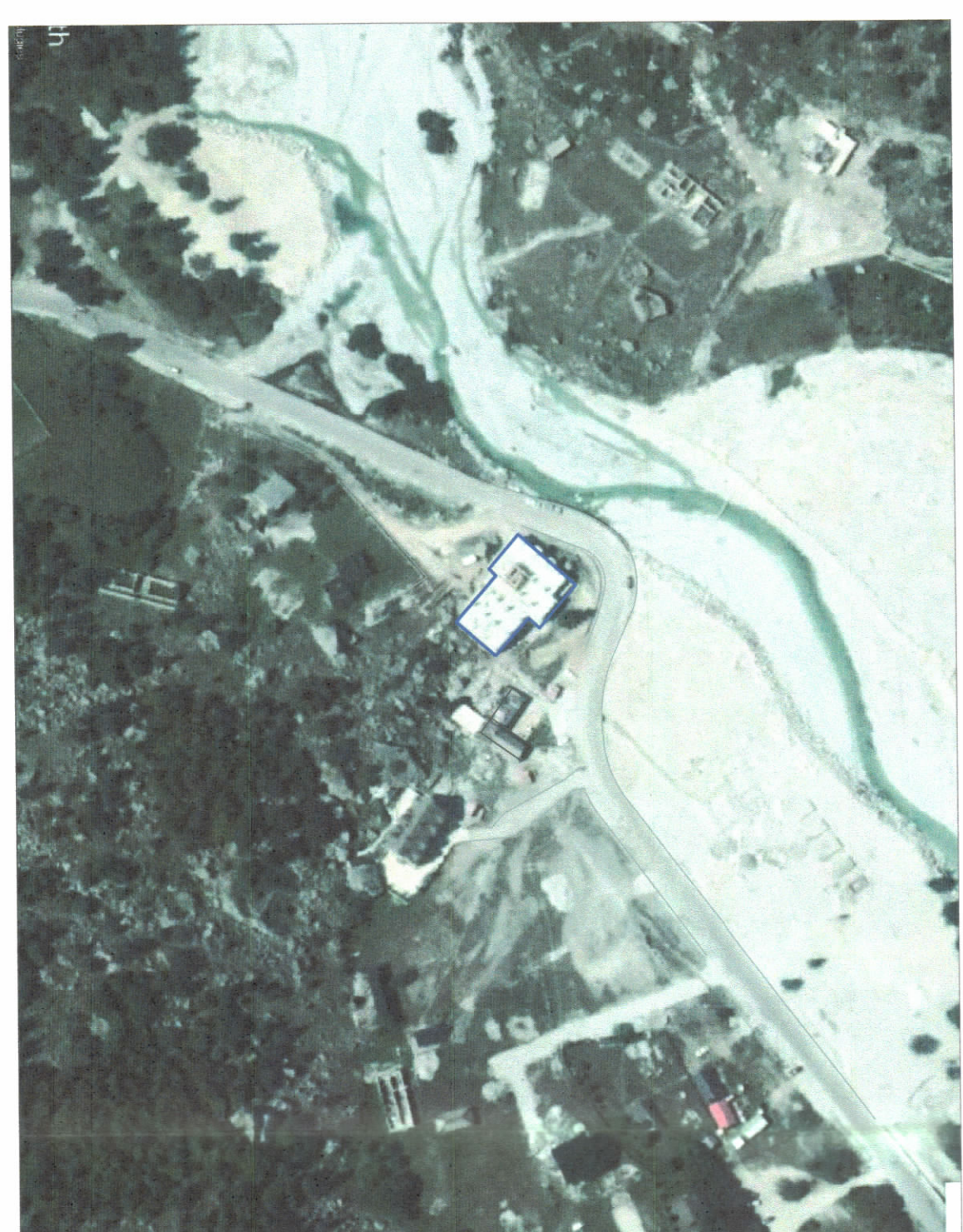
HARTA TOPOGRAFIKE SHK. 1:2000