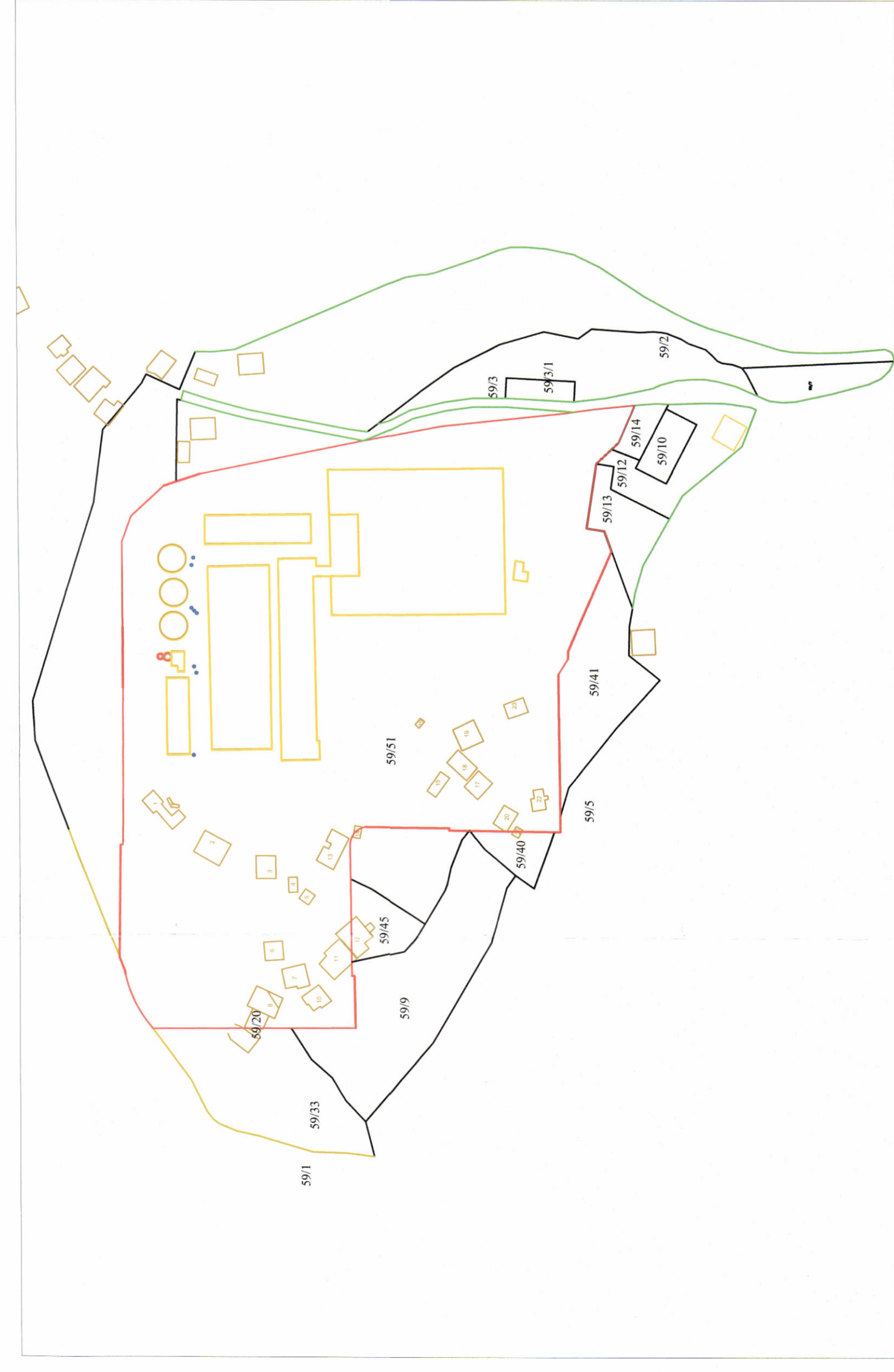
POZICIONI KADASTRAL SHK. 1:2000