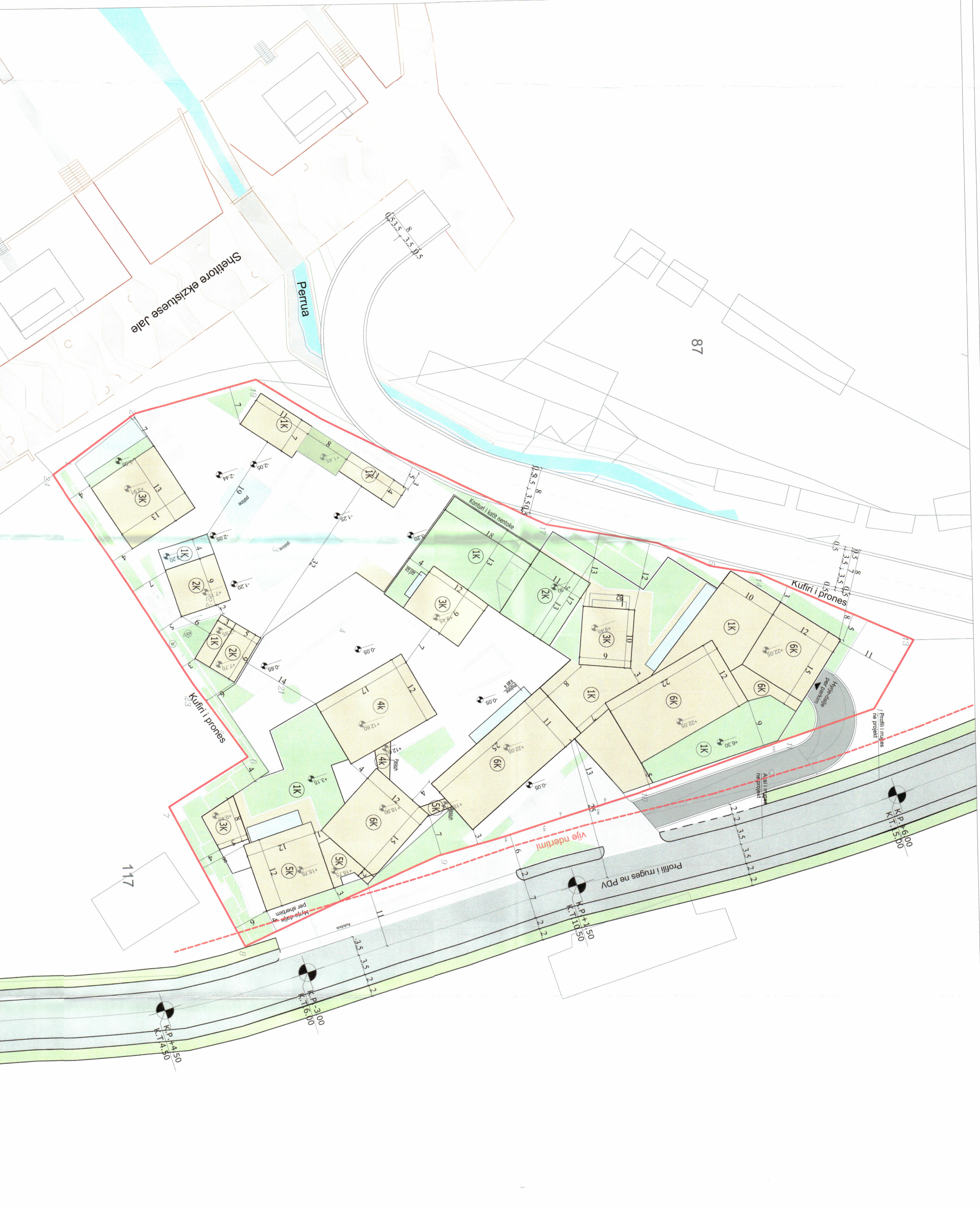
PLANI I VENDOSIES SË STRUKTURËS SHK. 1:350