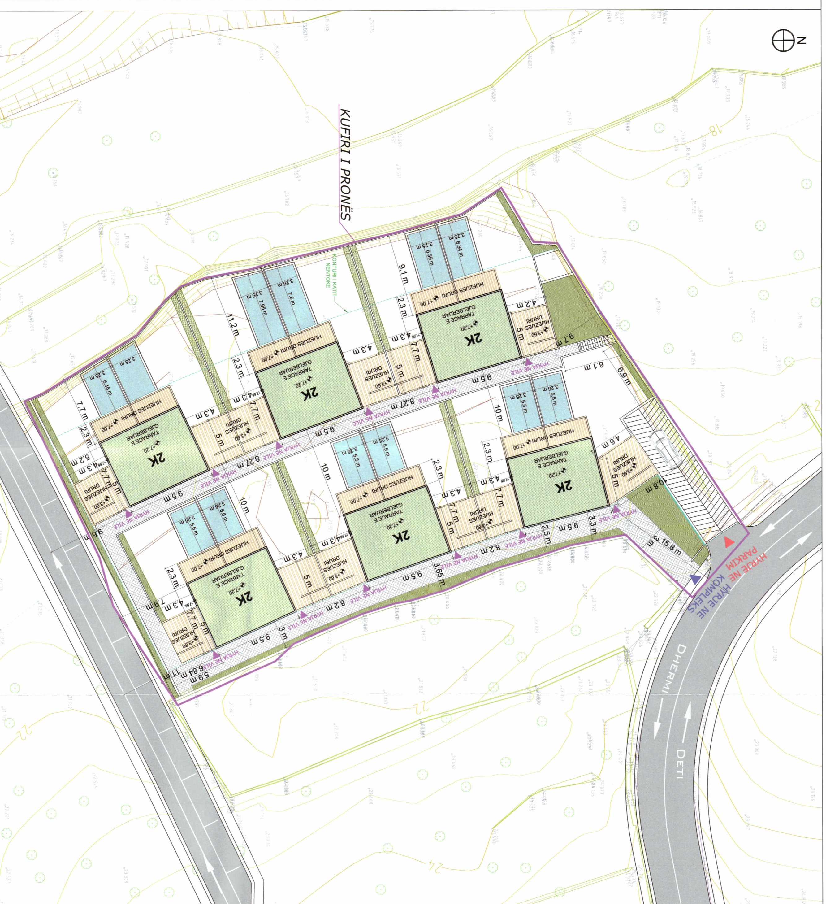
PLANI I VENDOSJES SË STRUKTURËS SHK. 1:250