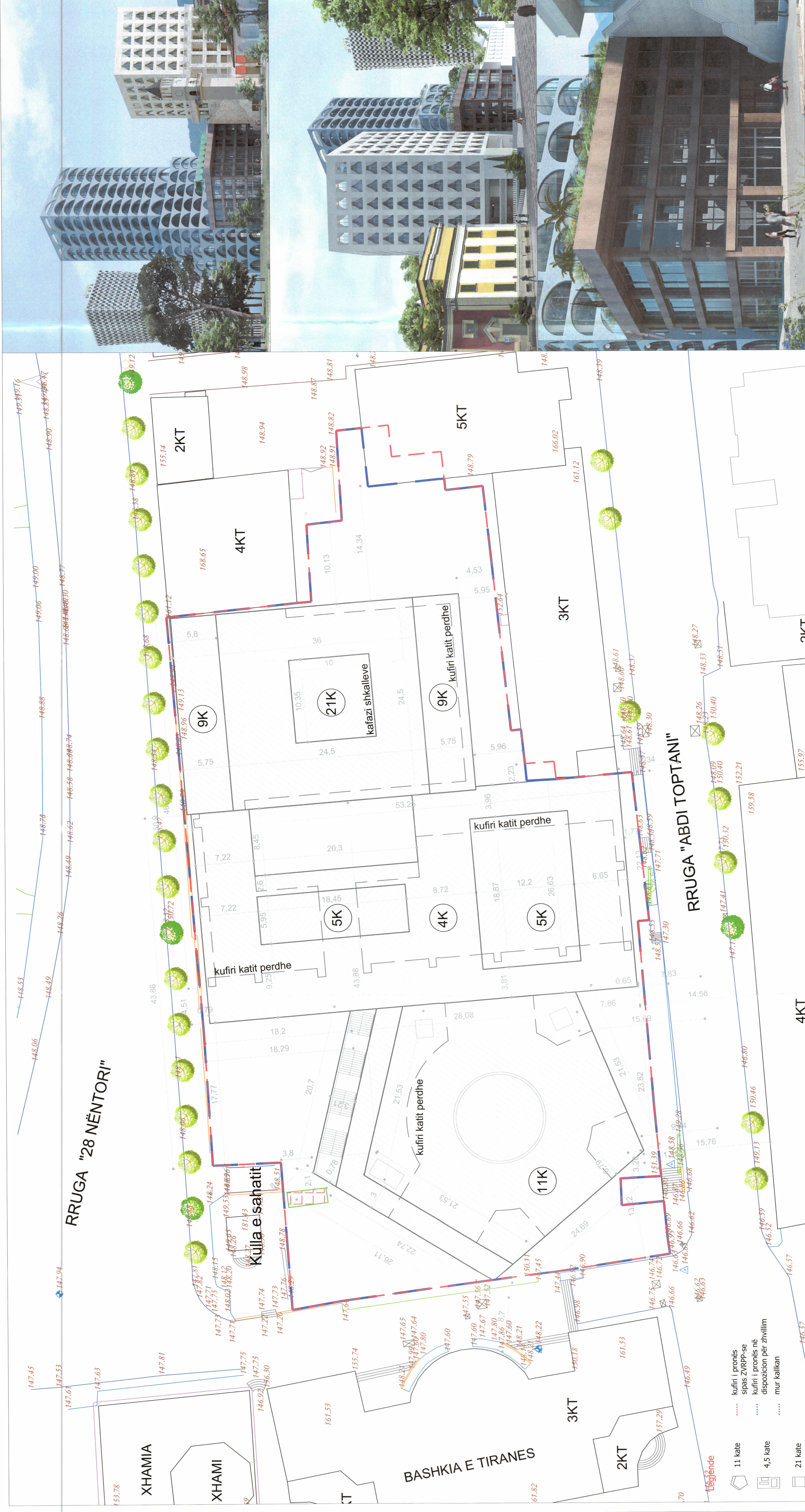
PLANI I VENDOSJES SË STRUKTURËS SHK. 1: 250

Ministër i Infrastrukturës dhe Energjisë