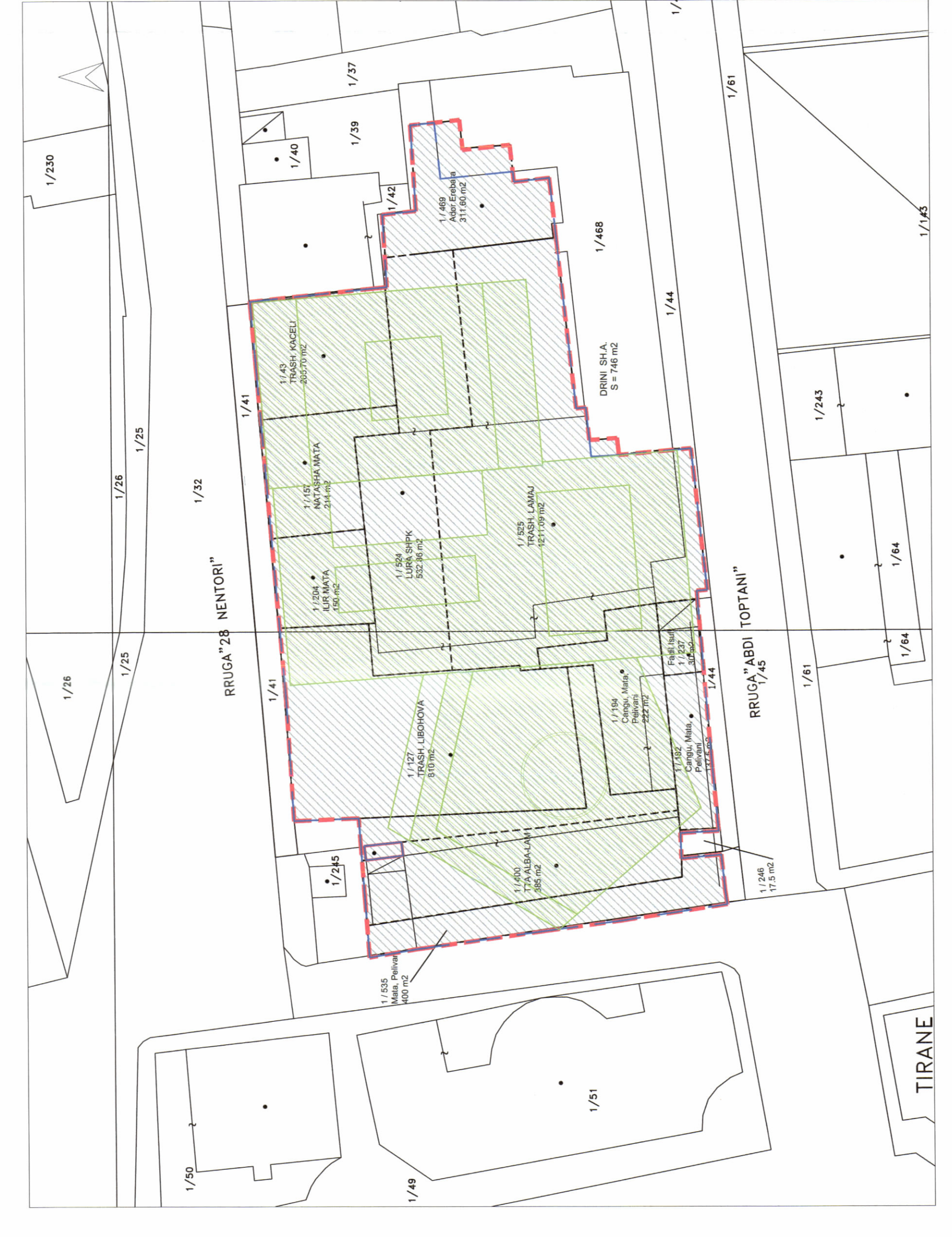
POZICIONI KADASTRAL SHK. 1:500