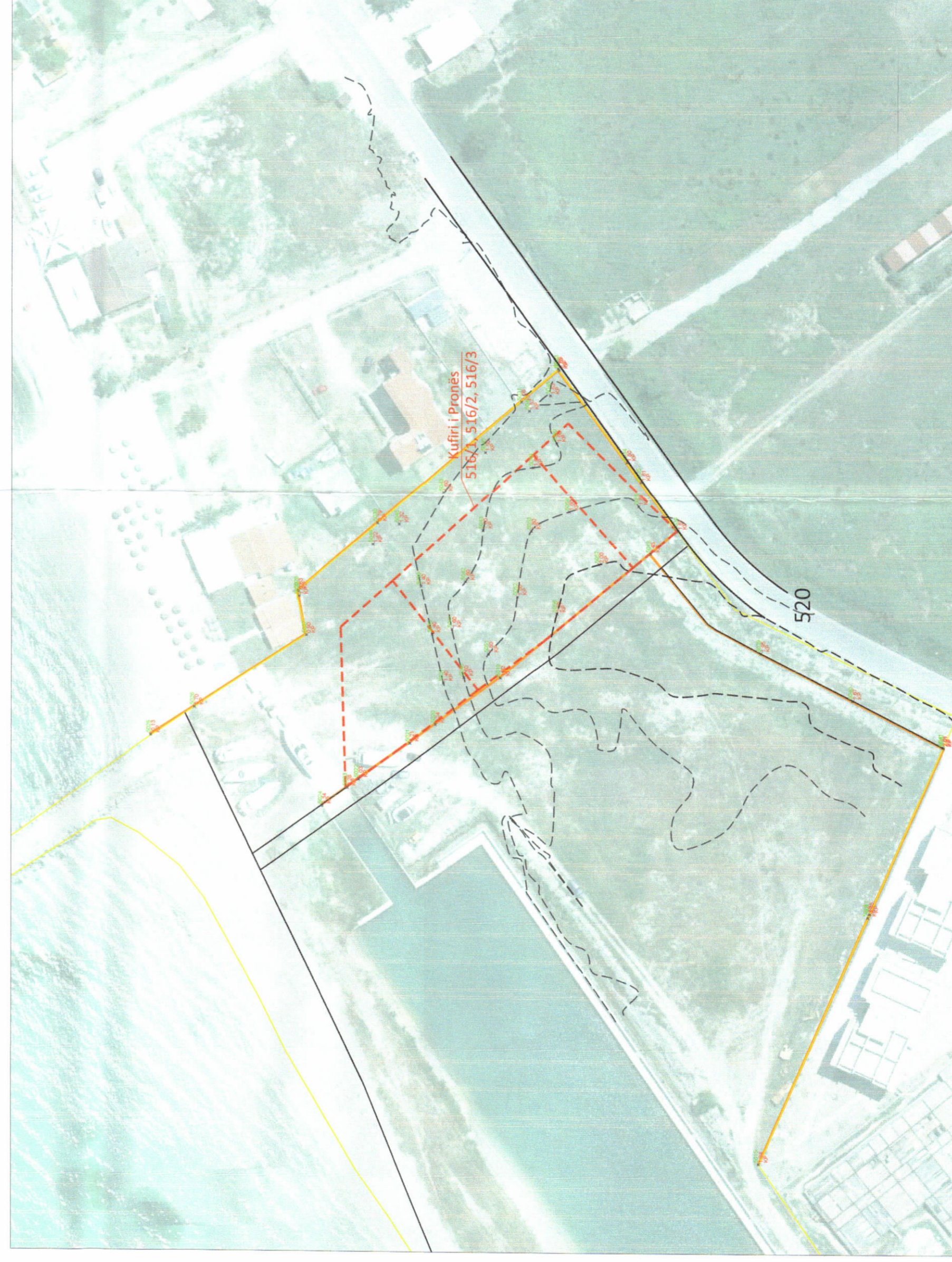
HARTA TOPOGRAFIKE SHK. 1:1000

TREGUESIT E ZHVILLIMIT: Sipërfaqe e përgjithshme e truallit: 3300m 2 Sipërfaqe e truallit që përdoret për zhvillim: 3300m 2 Sipërfaqe e truallit e zënë nga struktura (gjurma): 784.71m 2 Sipërfaqe e përgjithshme e ndërimit mbitoke: 4944.74m 2 Koeficienti i shfrytëzimit të truallit për ndërimit: 23.8% Intensiteti i ndërimit: 1.5 Lartësia maksimale e strukturës nga niveli i kuotës së sistemimit: 20m Numri i kateve mbi tokë: 5 kate Numri i kateve nën tokë: 1 kat