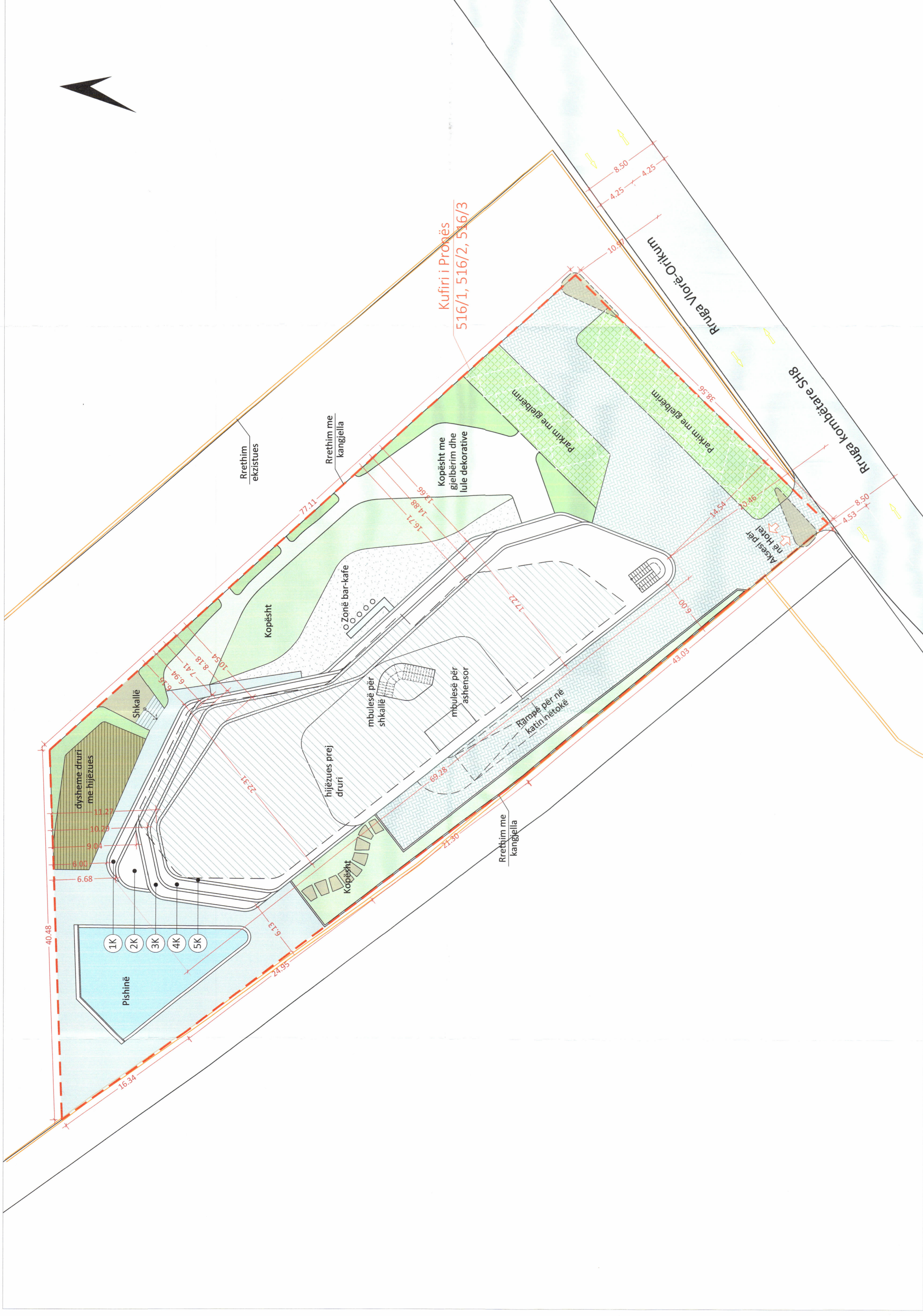
PLANI I VENDOSJES SË STRUKTURËS SHK. 1: 200