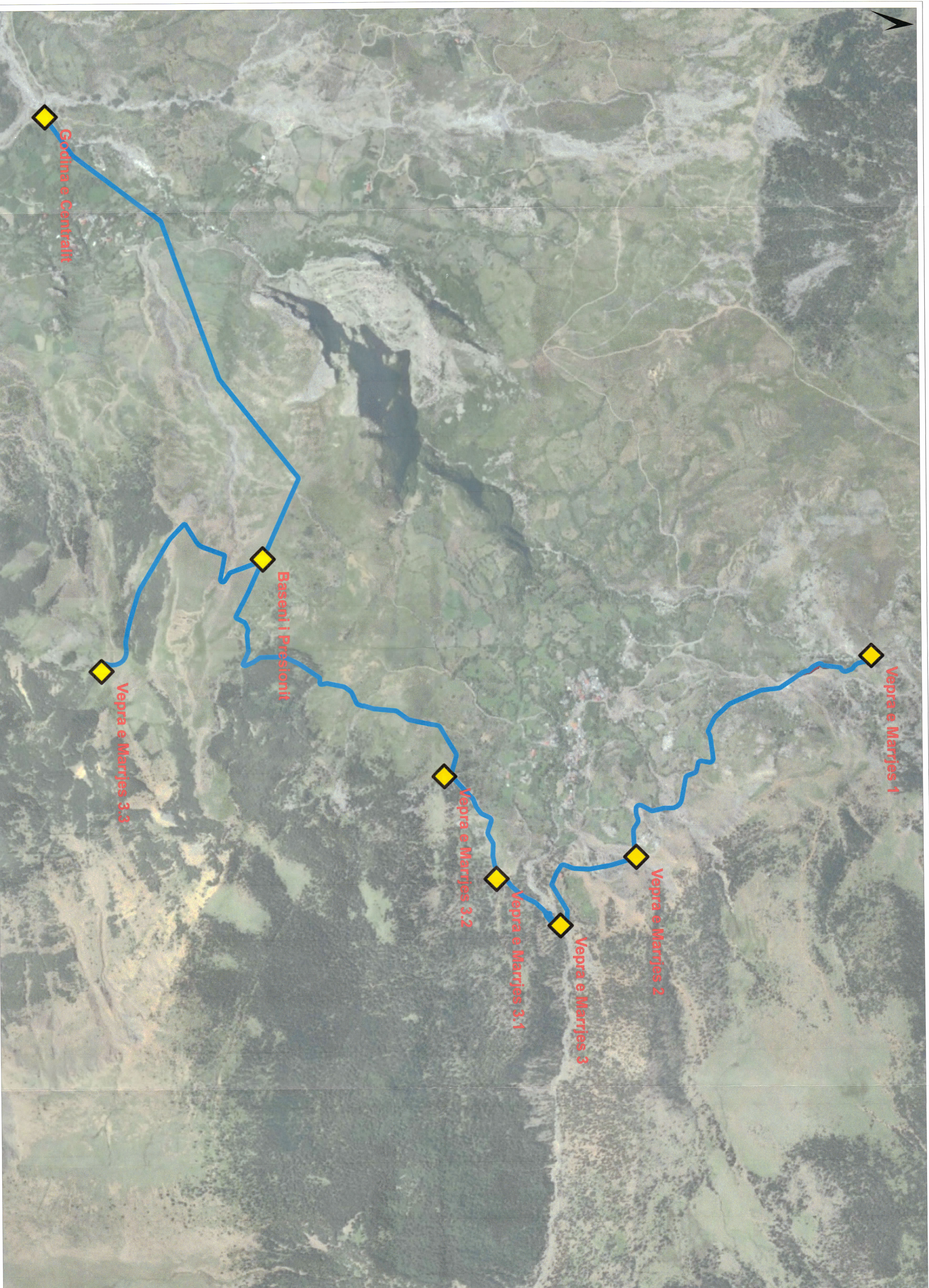
PLANI I VENDOSJES SE SHTRUKTURES HEC - GRABOVA 2