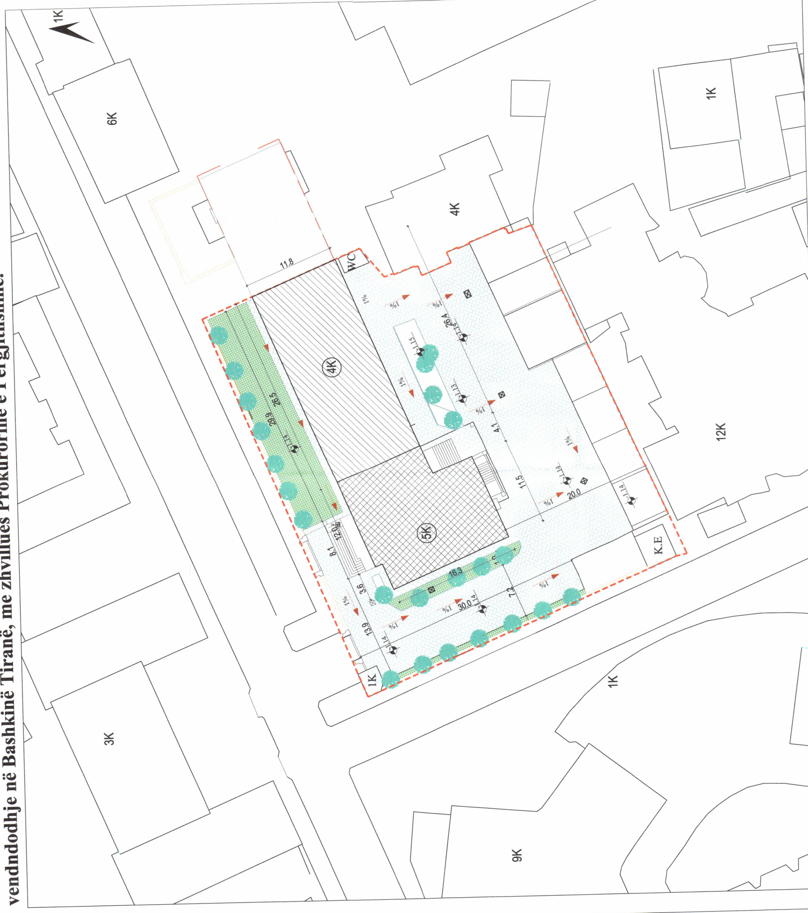
PLANI I VENDOSJES SË STRUKTURËS SHK. 1:200