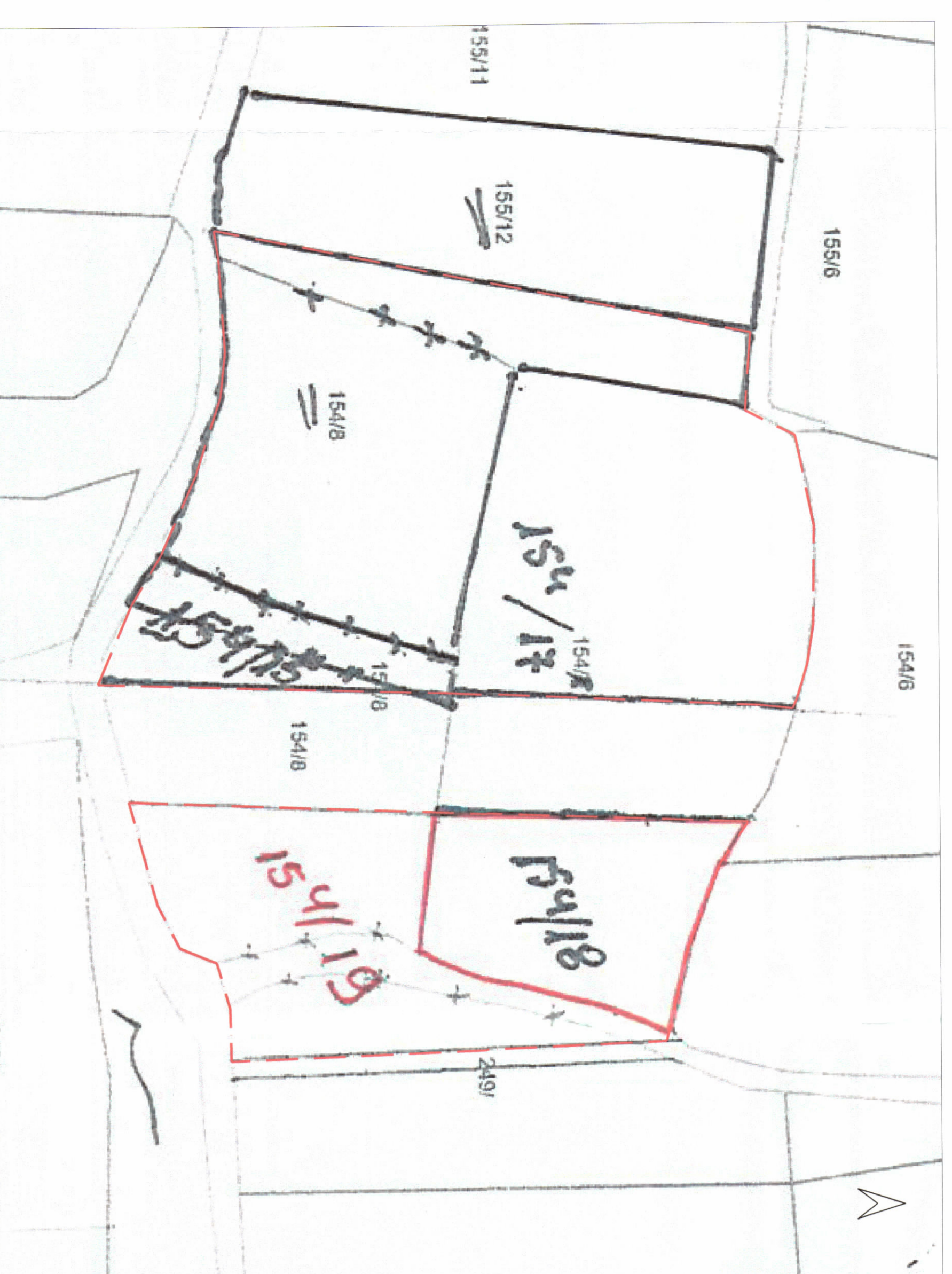
POZICIONI KADASTRAL SHK. 1:750