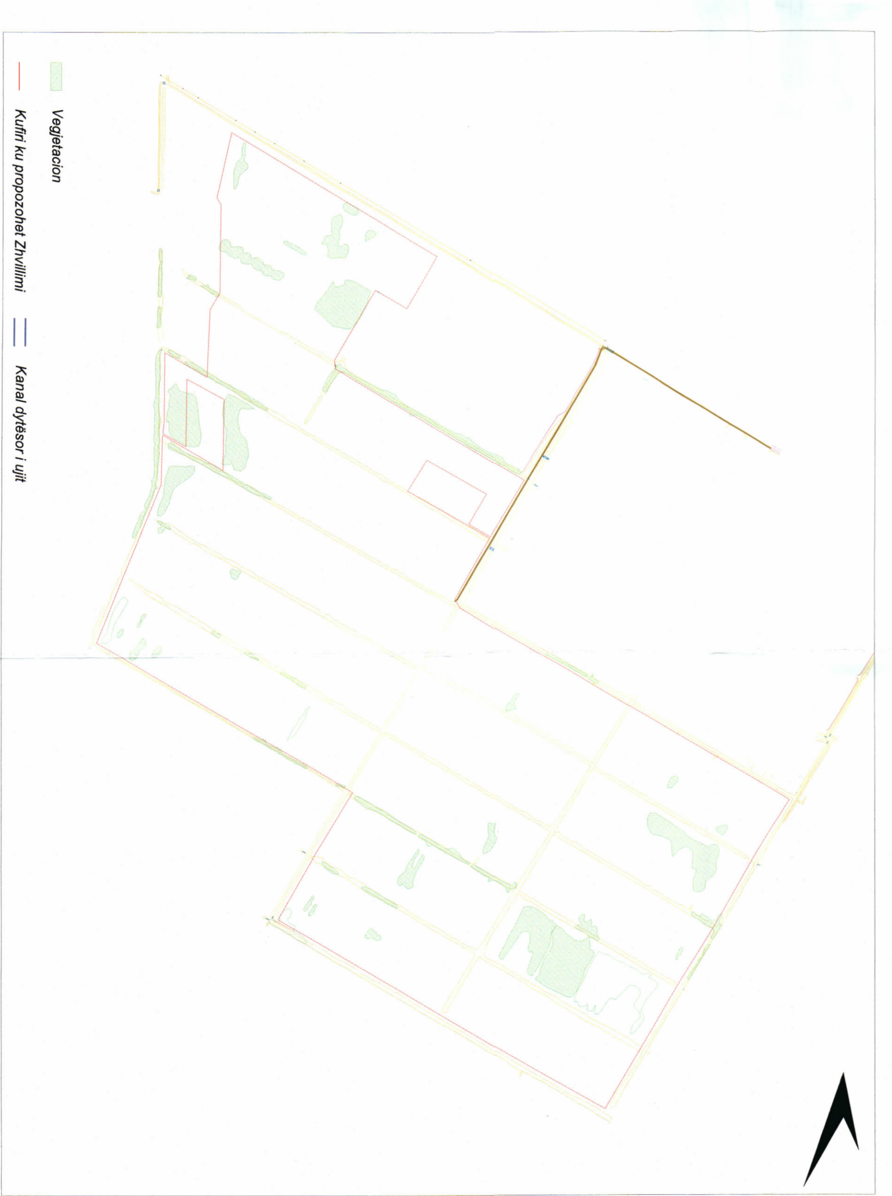
HARTA TOPOGRAFIKE SHK. 1:10,000

TREKËSIT E ZHVILLIMIT: Sipërfaqe e përgjithshme e truallit: 1,961,685 m 2 Sipërfaqe e truallit e zënë nga struktura (panele+objekte): 1,787,421 m 2 Sipërfaqe e truallit e zënë nga panelet: 1,785,255 m 2 Sipërfaqe e truallit e zënë nga objektet: 2166 m 2 Sipërfaqe e përgjithshme e ndërtimit për objektet: 2166 m 2 Koeficienti i shfrytëzimit të truallit për panele dhe objekte: 91% Koeficienti i shfrytëzimit të truallit për rrugë dhe hapësira të lira: 9% Intensiteti i ndërtimit: ±0.001 Lartësia maksimale e strukturës nga niveli i kuotës së sistemit: +4.50m Numri i katëve mbi tokë: 1KT Numri i katëve nën tokë: 0KT