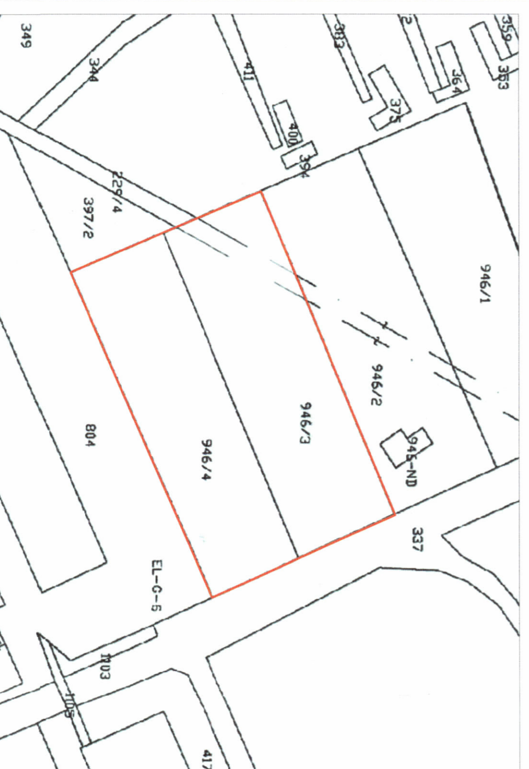
POZICIONI KADASTRAL SHK. 1:1500