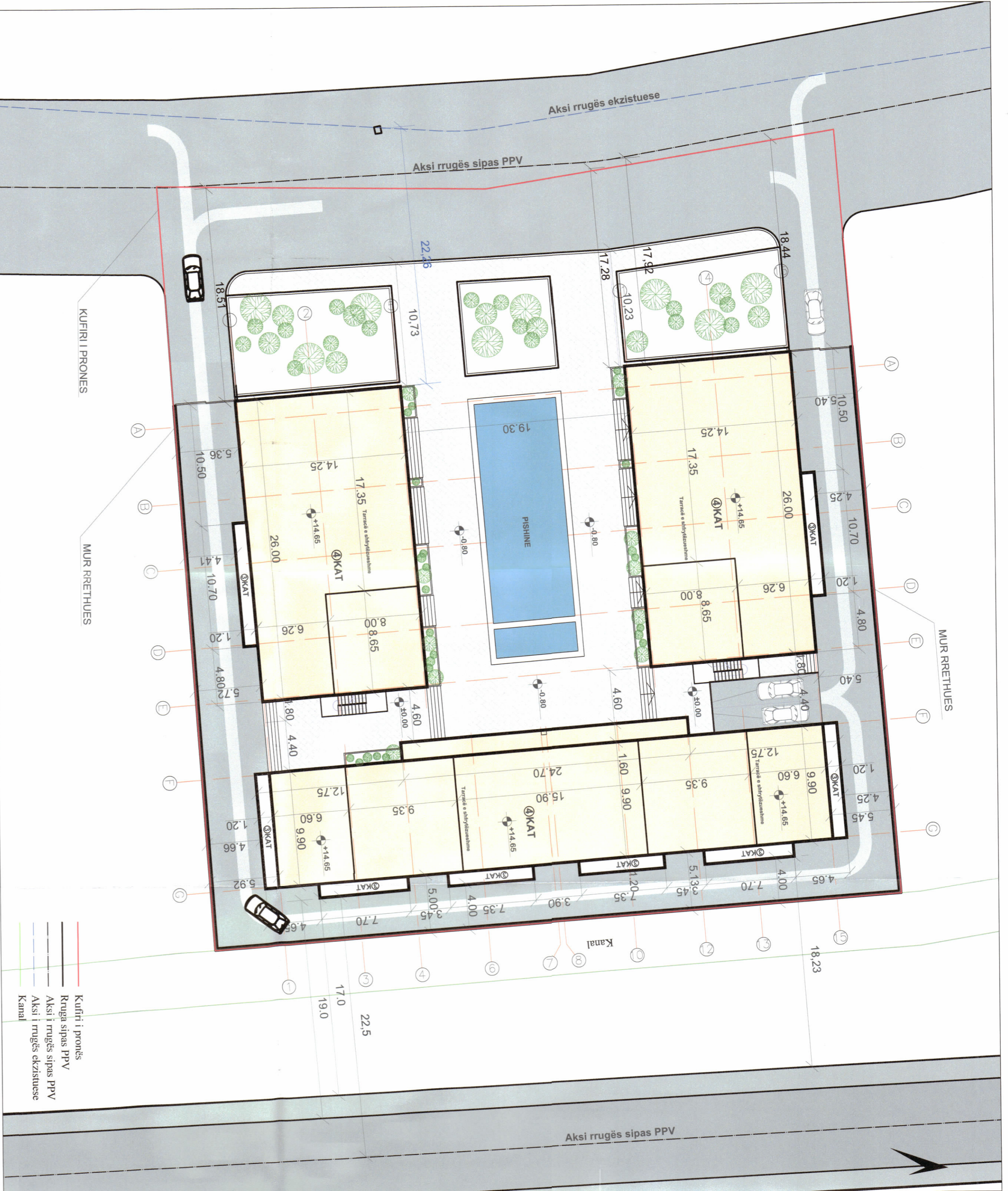
PLANI I VENDOSIES SË STRUKTURËS SHK. 1:250