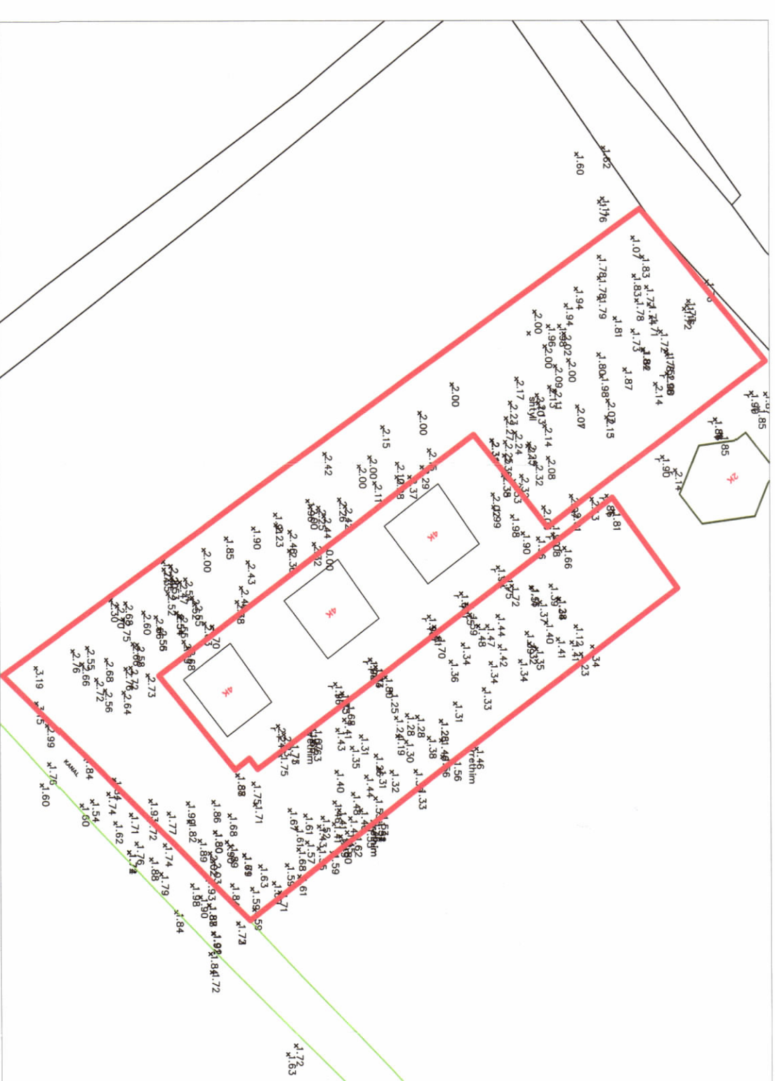
HARTA TOPOGRAFIKE SHK. 1:1250