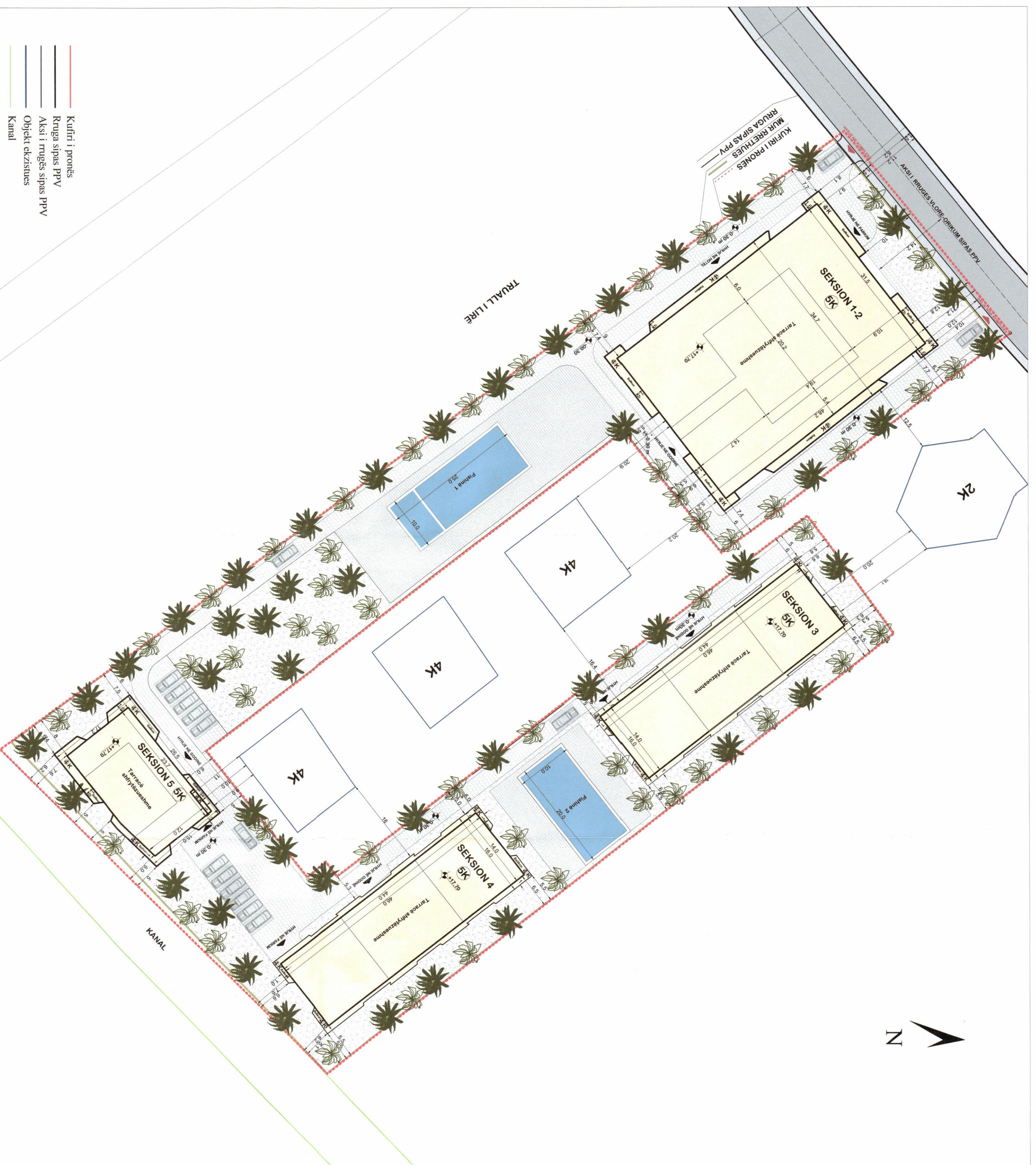
PLANI I VENDOSJES SË STRUKTURËS SHK. 1:500