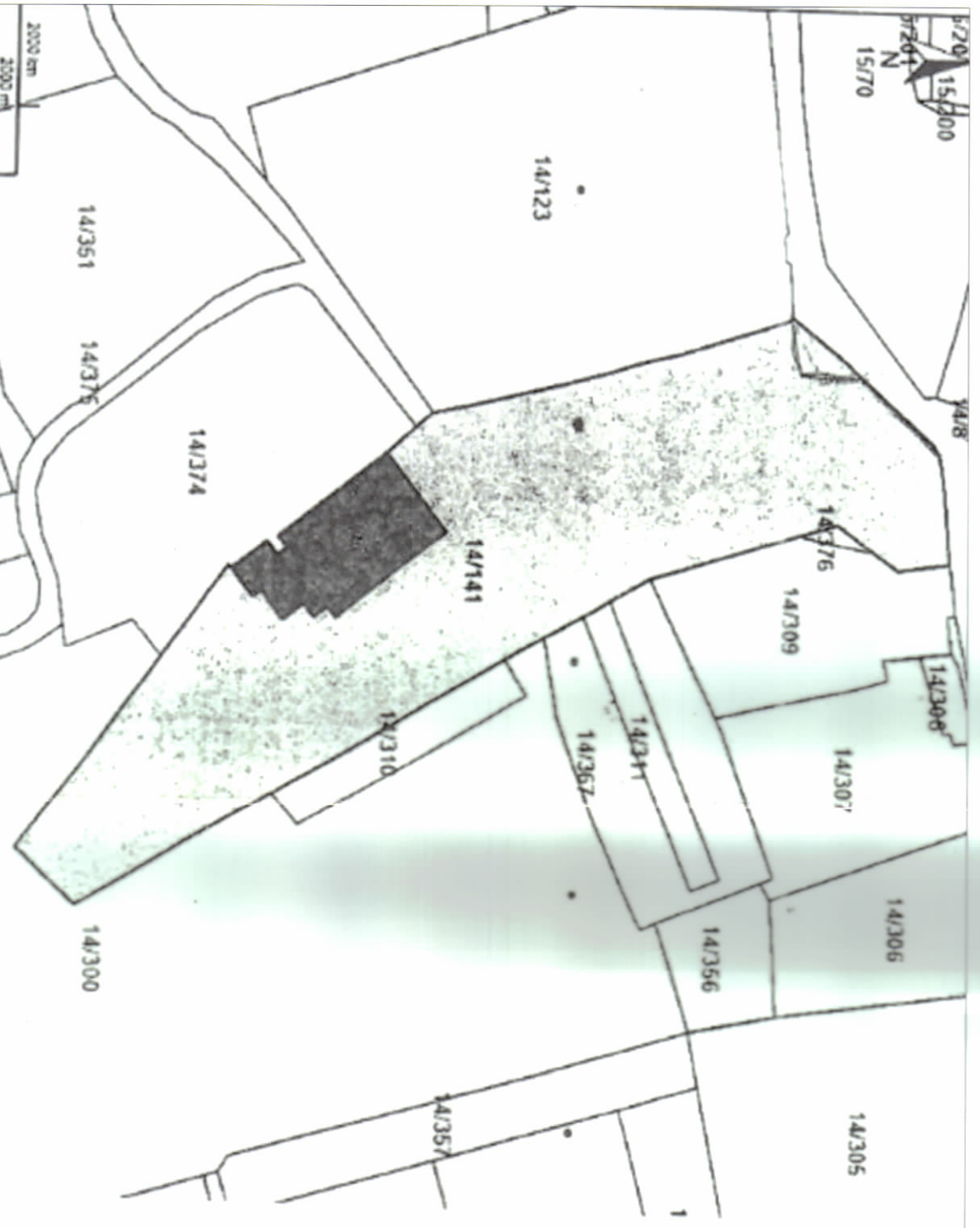
POZICIONI KADASTRAL SHK. 1:1000