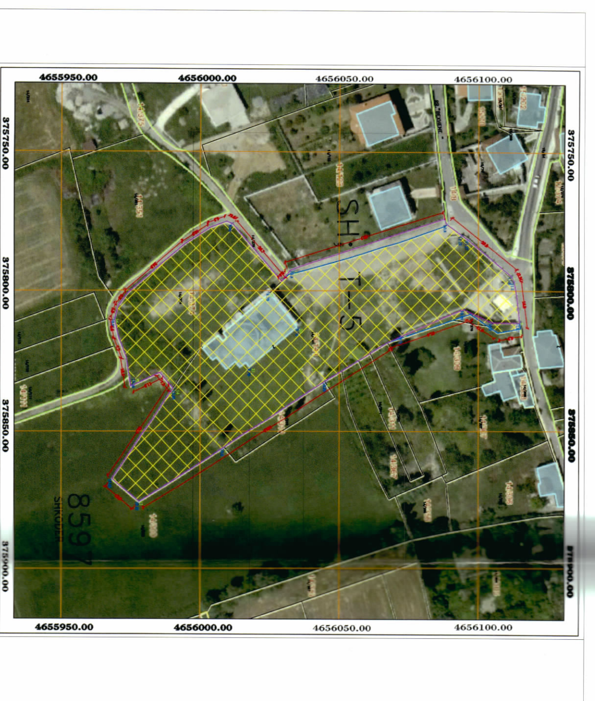
HARTA TOPOGRAFIKE SHK. 1:1500