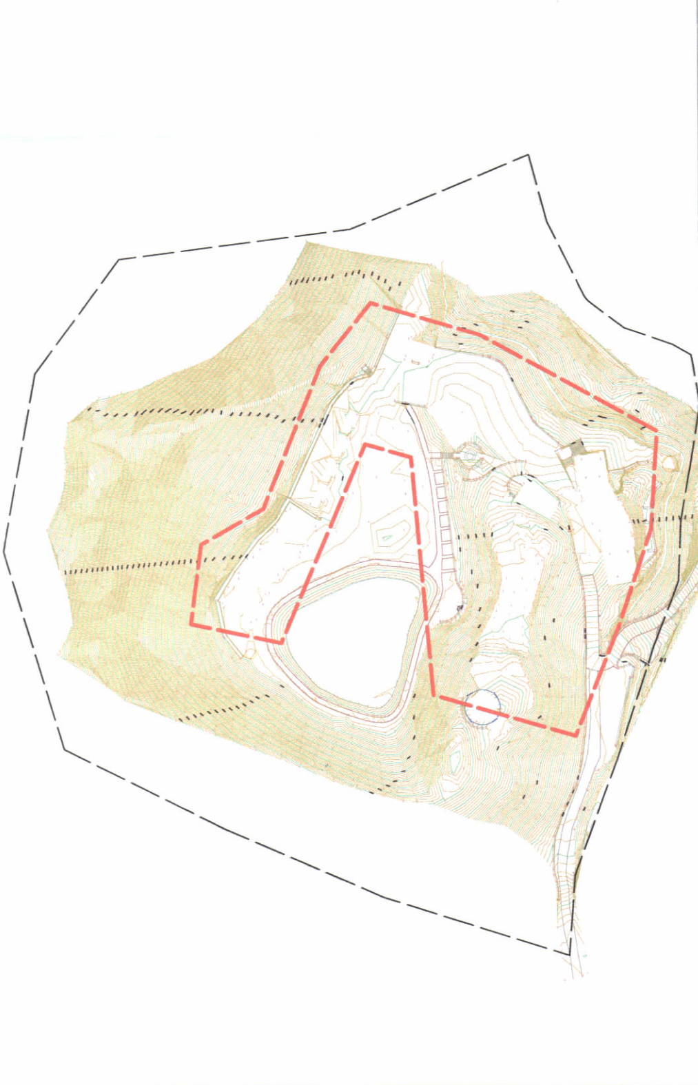
HARTA TOPOGRAFIKE SHK. 1:2000