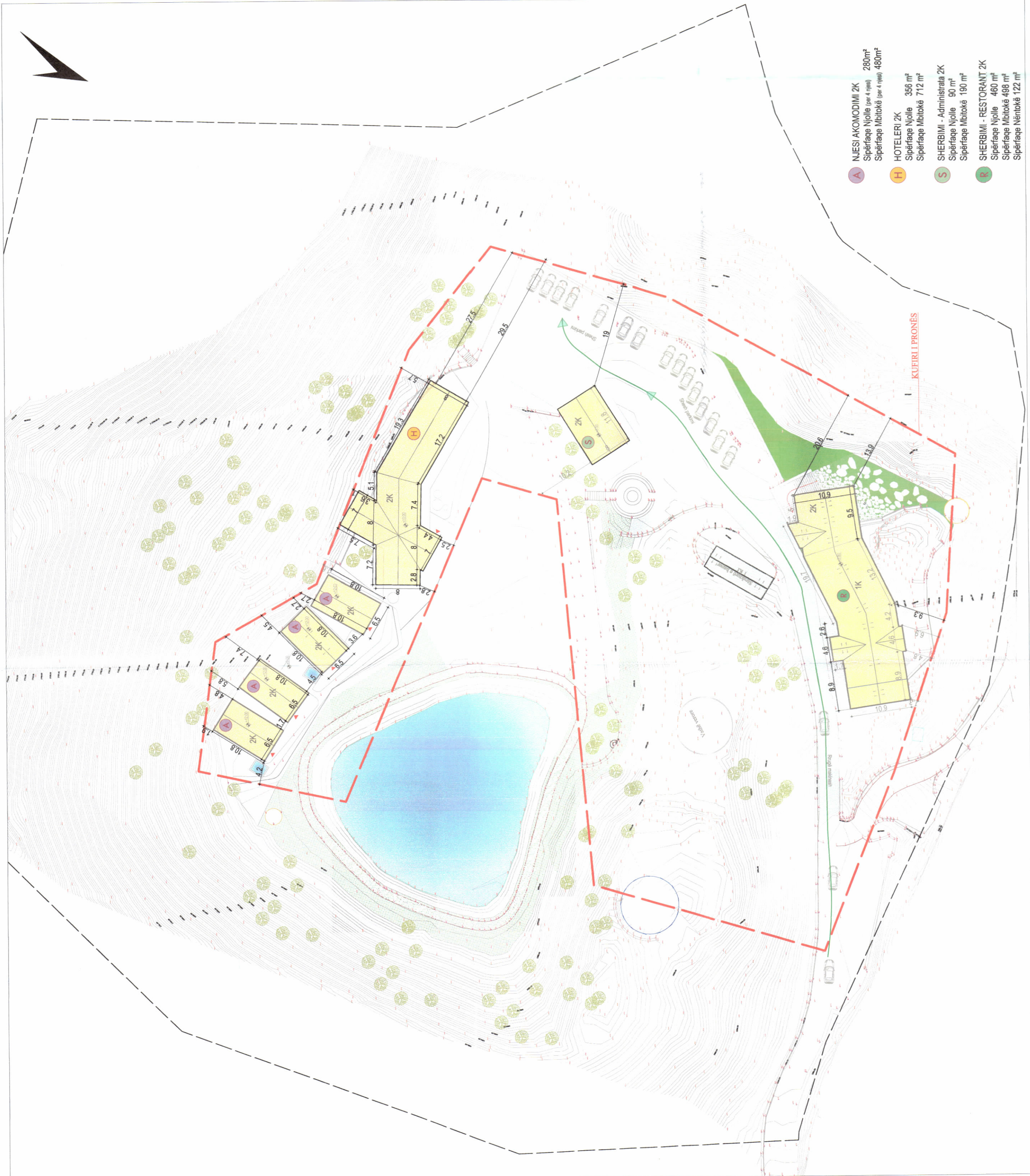
PLANI I VENDOSJES SË STRUKTURËS SHK. 1:500