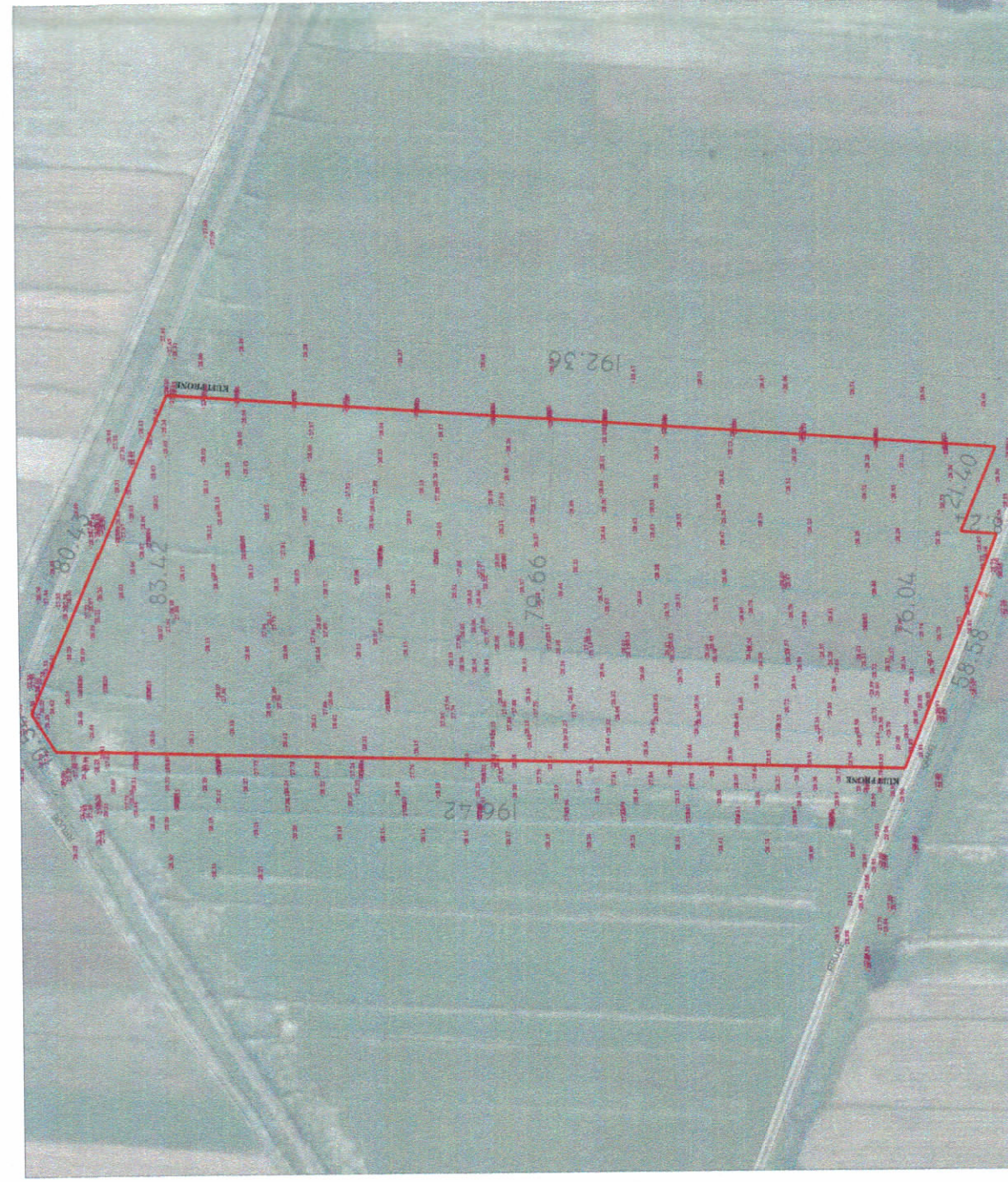
HARTA TOPOGRAFIKE SHK. 1:1500