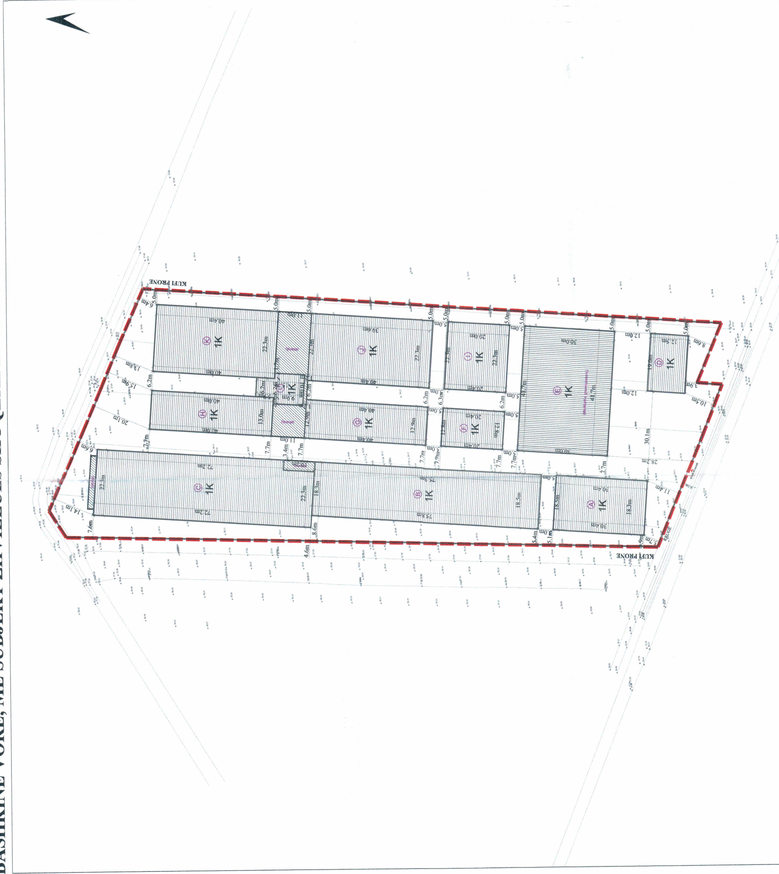
PLANI I VENDOSJES SË STRUKTURËS SHK. 1:750