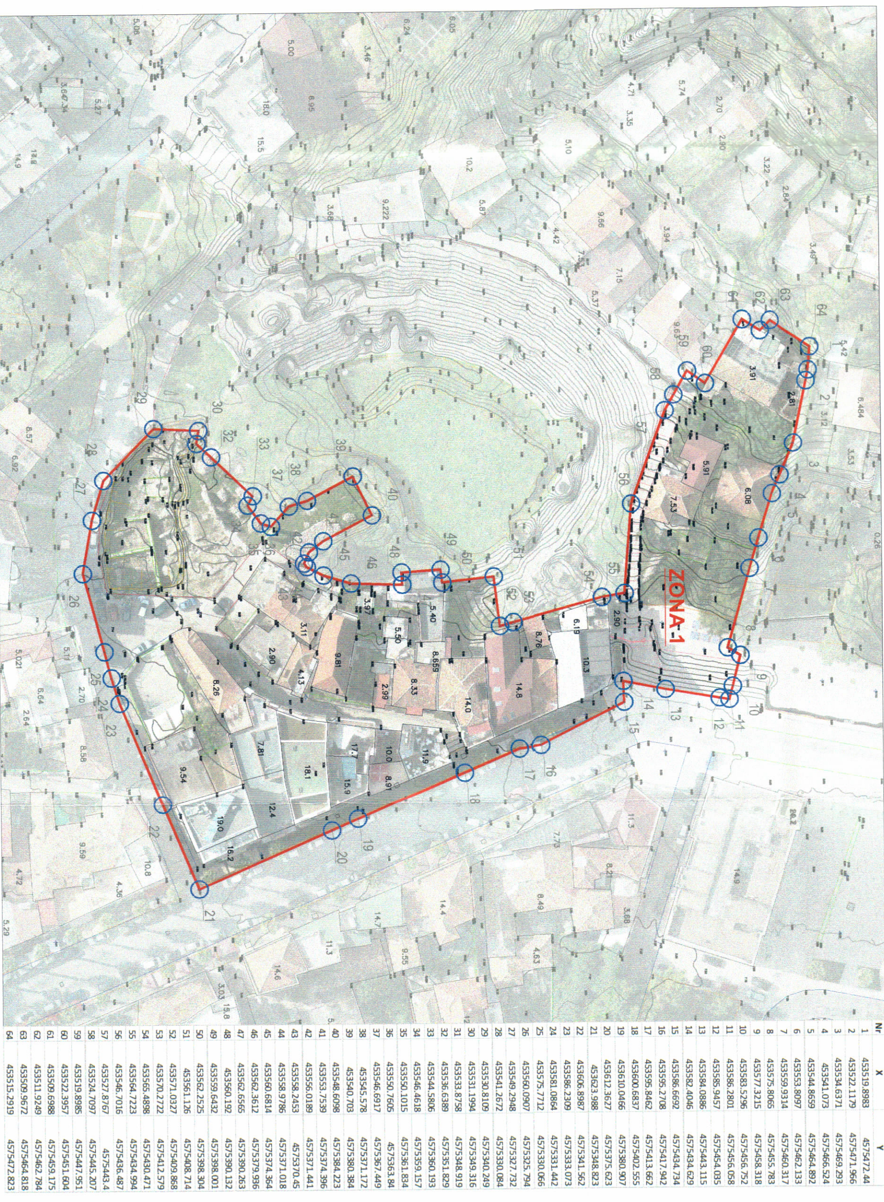
HARTA TOPOGRAFIKE SHK. 1:750