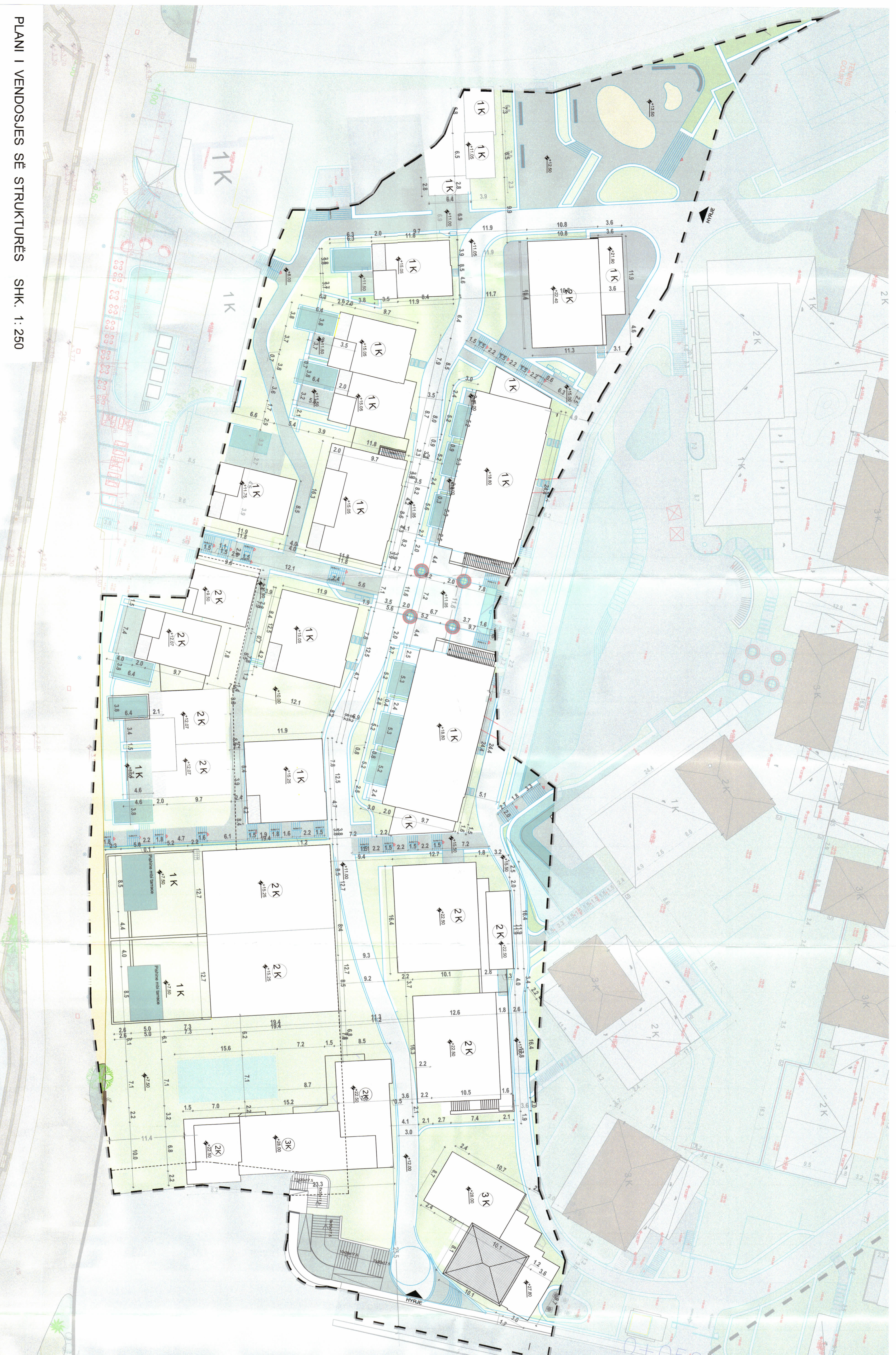
PLANI I VENDOSJES SË STRUKTURËS SHK. 1: 250